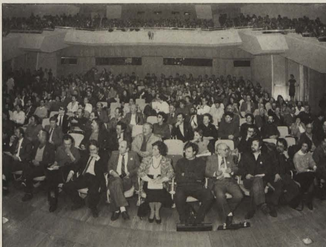
Veliko dvorano Cankarjevega doma v Ljubljani so napolnili člani Socialdemokratske zveze Slovenije in gostje iz Jugoslavije in inozemstva.