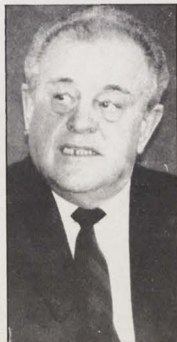
Predsednik AOK Heller

Slovenska športna zveza, Slovensko planinsko društvo Celovec in Slovensko prosvetno društvo „Rož“ v Šentjakobu v Rožu vabijo na