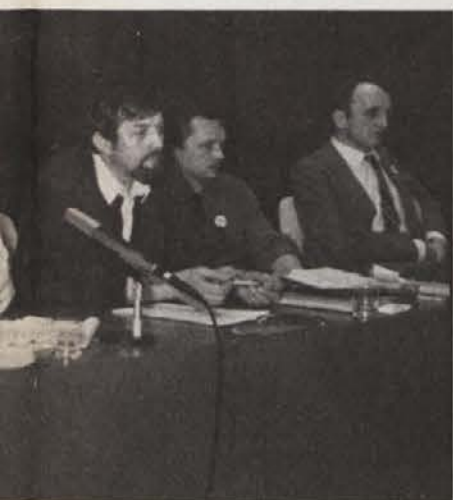
tja Boh (v sredini zgoraj). France Tom- nije.