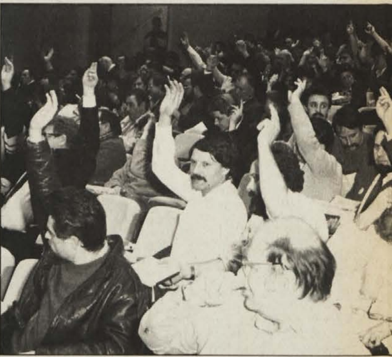
Pred kongresom je bilo mogoče pristopiti k Socialdemokratski zvezi in statut sprejeli soglasno (zgoraj).