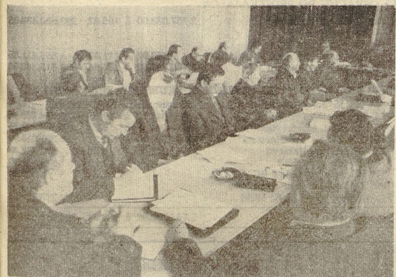
Predstavniki članic Poslovne skupnosti za hmeljarstvo Slovenije so se 16. januarja zbrali na seji skupščine v dvorani DO Hmezad eksport-import v Žalcu in razpravljali o zelo-aktualnih vprašanjih. Seja je bila dolgovozna, nekonstruktivna in ni dosegla pričakovanega uspeha. O sprejetih sklepih berite v naslednjem Hmeljarju.