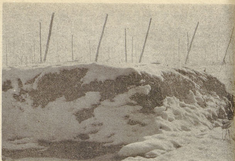
Kompost za nove nasade zori na robu hmeljišča. Premetavanje ob ugodnem vremenu bo zorenje še pospešilo