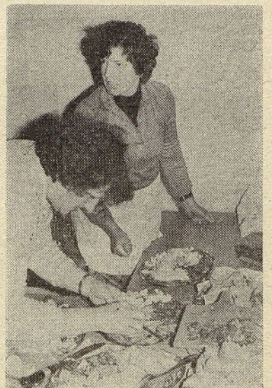
Sentjurske žene so z znanjem, ki so ga pridobile na kuharskih tečajih, pripravile vsem udeležencem okušno zakusko

V hlevu ima 10 do 12 krav, dve tretjini črno-belih in 1/3 rjavih. Po izračunu KIS Zavoda za živinorejo je dosegel po kravi proizvodnjo 4.907 litrov. Za celjske mlekarne je bilo odkupljeno 45.327 litrov mleka. Sodeloval je na živinorej-