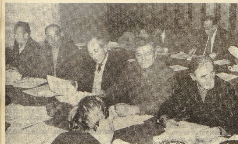
Del delegatov, ki so na svojem 1. zboru 30. 12. 1980 bili delavni in so sprejeli programska izhodišča za delo HIP v obdobju 1981—1985