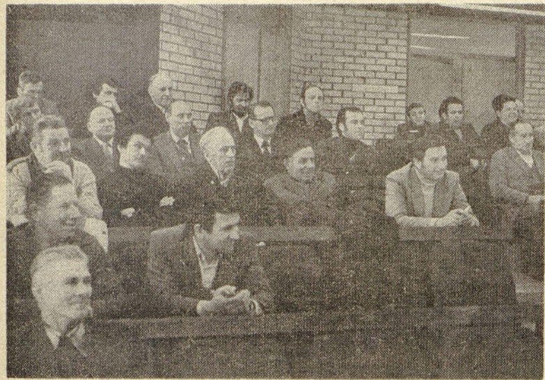
Najboljši rejci krav mlekaric celjske regije so se zbrali na slavnostni podelitvi v sejni sobi Skupščine občine Sentjur. Med njimi so tudi kooperanti KZ Savinjska dolina

Ima povprečno 6 krav rjave pasme, s proizvodnjo 4.548 litrov mleka po kravi. V letu 1979 je za celjske mlekarne prodal 17.590 litrov mleka. S svojo čredo je sodeloval na živinorejskih razstavah v Medlogu, Gornjem Gradu in Vranskem.