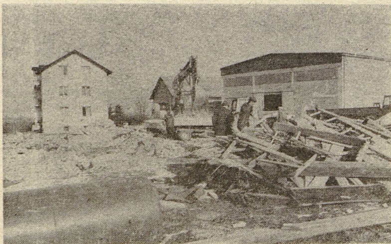
Staro kmečko hišo na Mirošanu so podrli in na njenem mestu bo kmalu zraslo sodobno gospodarsko poslopje z menzo, stanovanji in drugimi prepotrebnimi prostori

Skupaj 2,764.706,92 à 106,64 294,815.849,90