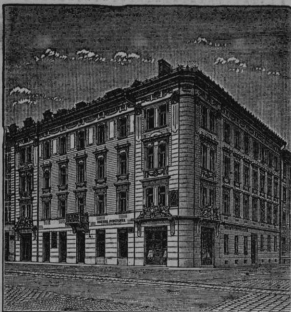
Stanje upravnega premoženja: K 17,519.983-93.

Denarni promet do konca leta 1908: K 71,417.342-75.