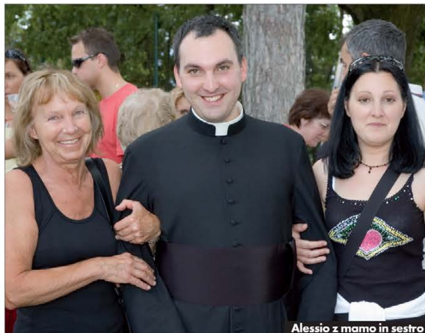
Alessio z mamo in sestro