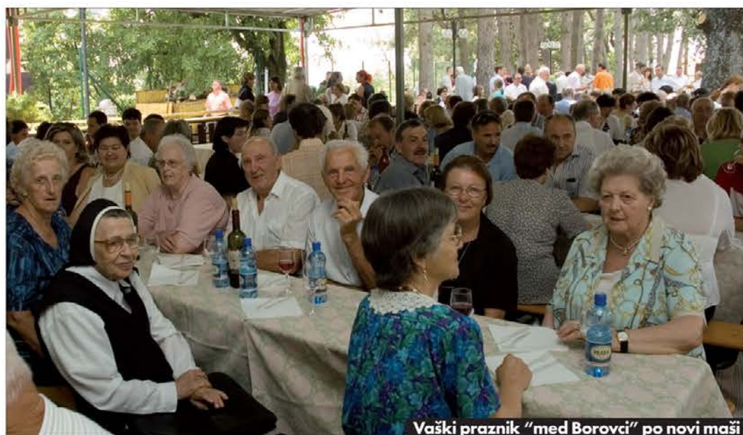
Vaški praznik "med Borovci" po novi maši