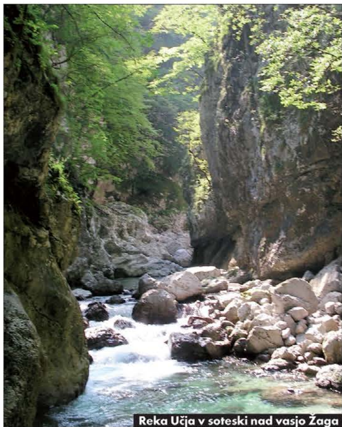
Reka Učja v soteski nad vasjo Žaga

Zagožen je spregovoril o prihodnjem razvoju izkoriščanja slovenskih hidroenergetskih virov s stališča turizma, predstavnik ministrstva za gospodarstvo