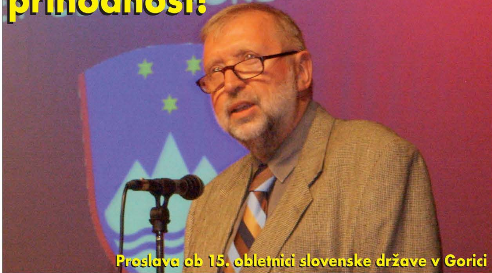
Proslava ob 15. obletnici slovenske države v Gorici