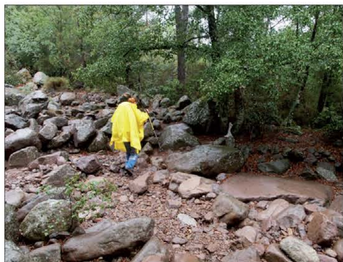
Kljub non stop nalivanju sva jo za razliko od sotrpinov dobro odnesla

no hojo se je med dlanjo in ročajem ustvaril poseben penast sloj. Dlani so bile res grozljive. Povsem so pobledele, tako kot med daljšim stikom z vodo običajno poblede koža okrog nohtov na rokah ali nogah. "Ej, pomisli, kakšna imava šele stopala," sem poskusil še enkrat. To sem ustrelil, ne da bi prej dejansko pomislil, in kakšnem stanju so stopala, ujeta v spužvasto namočene nogavice, zataknjene v razmočene gozdarje. Ko sem si v na-