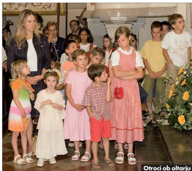
Otroci ob oltarju