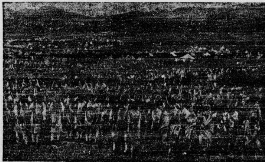
Abesinci se zbirajo pred Addis Abebu, kjer jih razvrščavajo v čete in odpošiljajo na bojišče.

d Opozorilo. Vedno pogosteje se pojavljajo po naših vaseh ljudje, ki so sumljivi in se izdajajo za pogorelce, a so v resnici pravi sleparji, ki menijo, da na ta način od ljudi več prejmejo. Prav je, da damo siromakom kar jim moremo dati, a da bi na nepošten na-