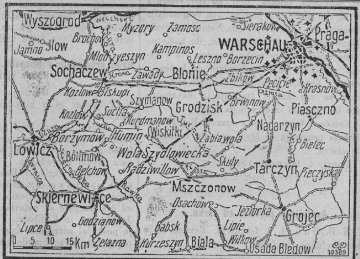
Karte zu den Kämpfen vor Warschau.

Z ozirom na naša uradna poročila o gigantskih bojih združenih nemških in avstro-ogrskih armad zoper Ruse in zlasti za trdnjavo Varšavo, prinašamo danes mali zemljevid z okolico Varšave, ki bo gotovo cenjene čitatelje zanimal.