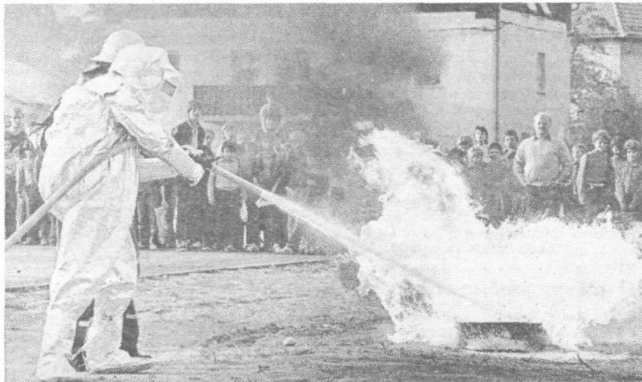
Namen vaje je bil pokazati zaščito in reševanje v primeru požara in ogroženosti okolja pred nevarnimi snovmi. Konkretno so izvajali: gašenje požara velikih razmer z uporabo tehnike, reševanje z višin, evakuacija ljudi z ogroženega objekta, oskrba in transport poškodovanih v bolnišnice ter preprečevanje in sanacija onesnaženega zemljišča.

požarne ogroženosti in ukrepov za preprečevanje. Pri tem je bilo tudi pričeto usklajevanje aktivnosti izvajalcev nalog v KS (gasilska društva, organizacija združenega dela, šole in VVZ) ter med KS. Sočasno so potekali preventivni pregledi stanovanjskih zgradb v KS, poslovnih prostorov ter delovnega okolja skladišč v OZD. Uspešno je tudi pričelo povezovanje in usklajevanje programov na izvedbo skupnih zaključnih vaj preventivnih aktivnosti in prikazov preprečevanja in reševanja ob morebitnih požarih kot n. pr. v KS Milan Česnik, Malči