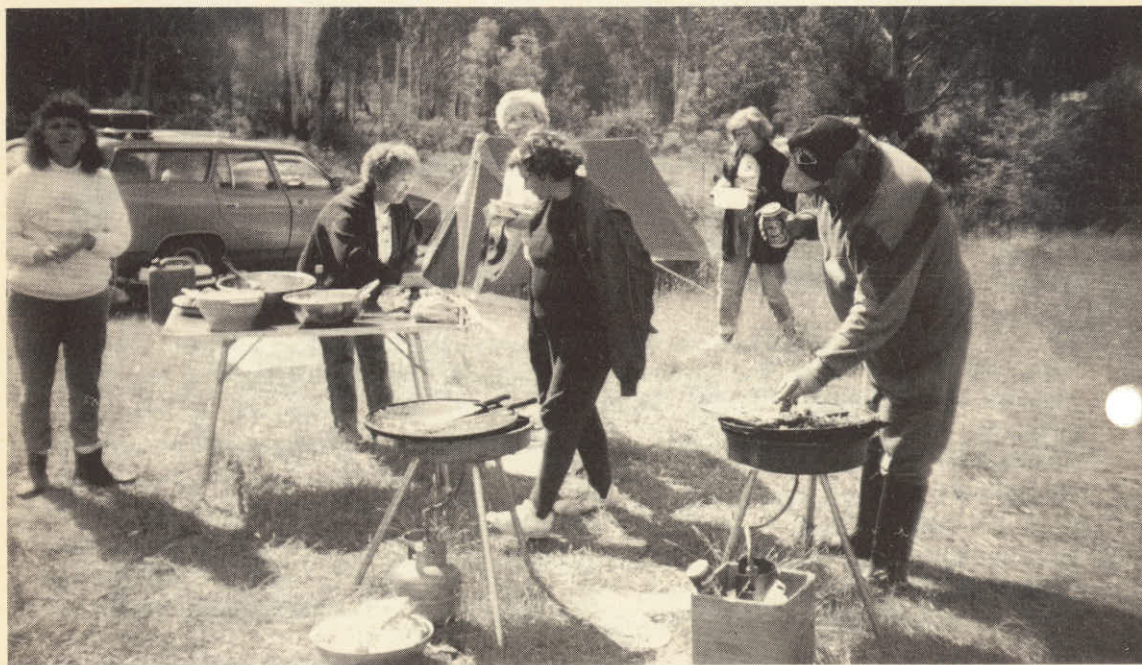
PIKNIK V NARAVI.