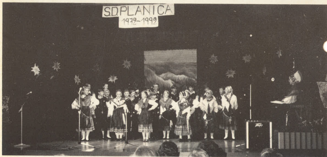
STAREJŠA IN MLAJŠA FOLKLORNA SKUPINA PLANICE.