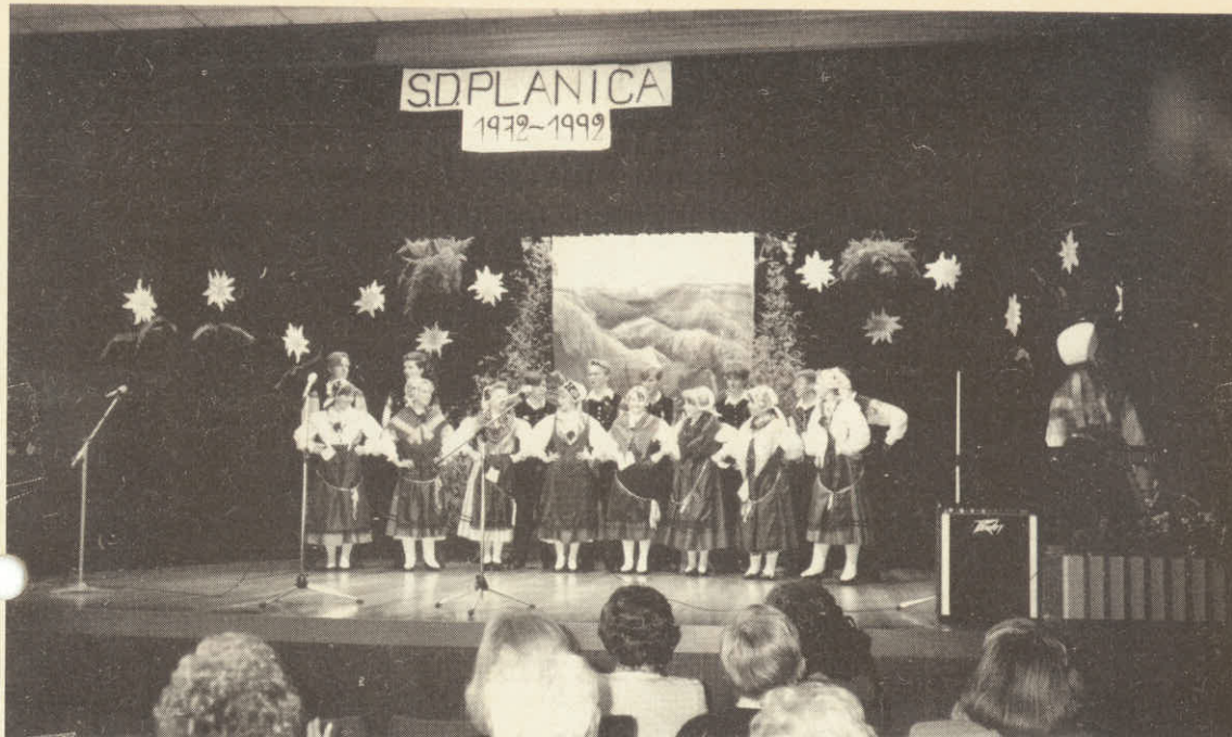
20 OBLETNICA S.D. PLANICA