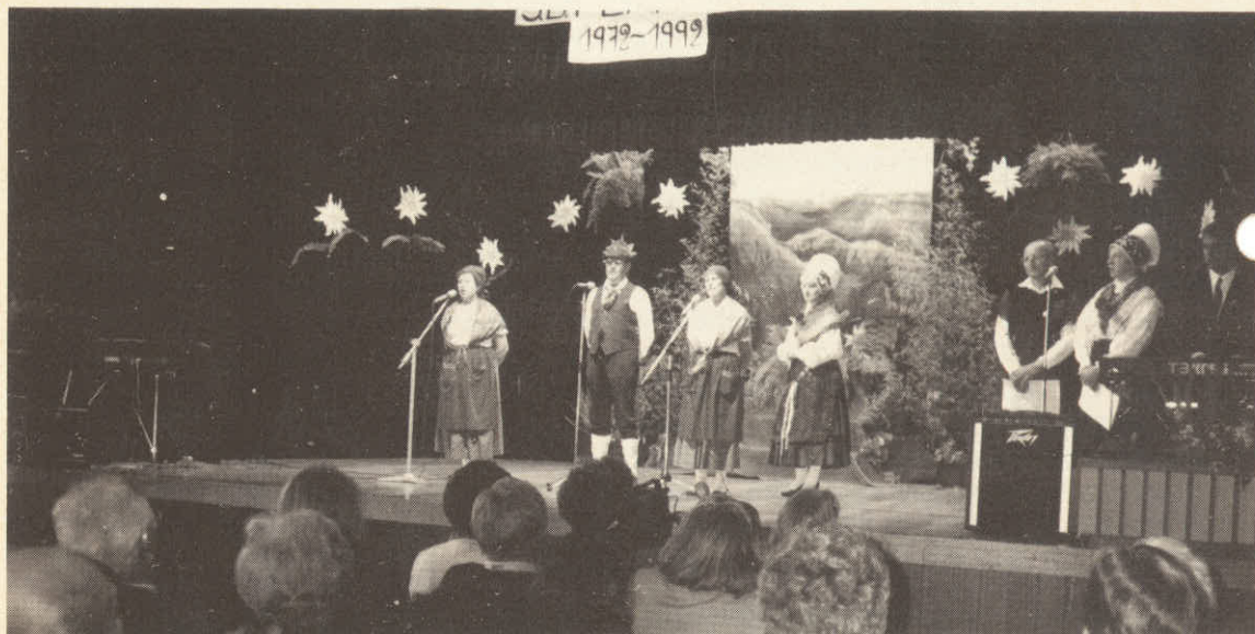
Nastopajoči na 20 obletnici našega društva.