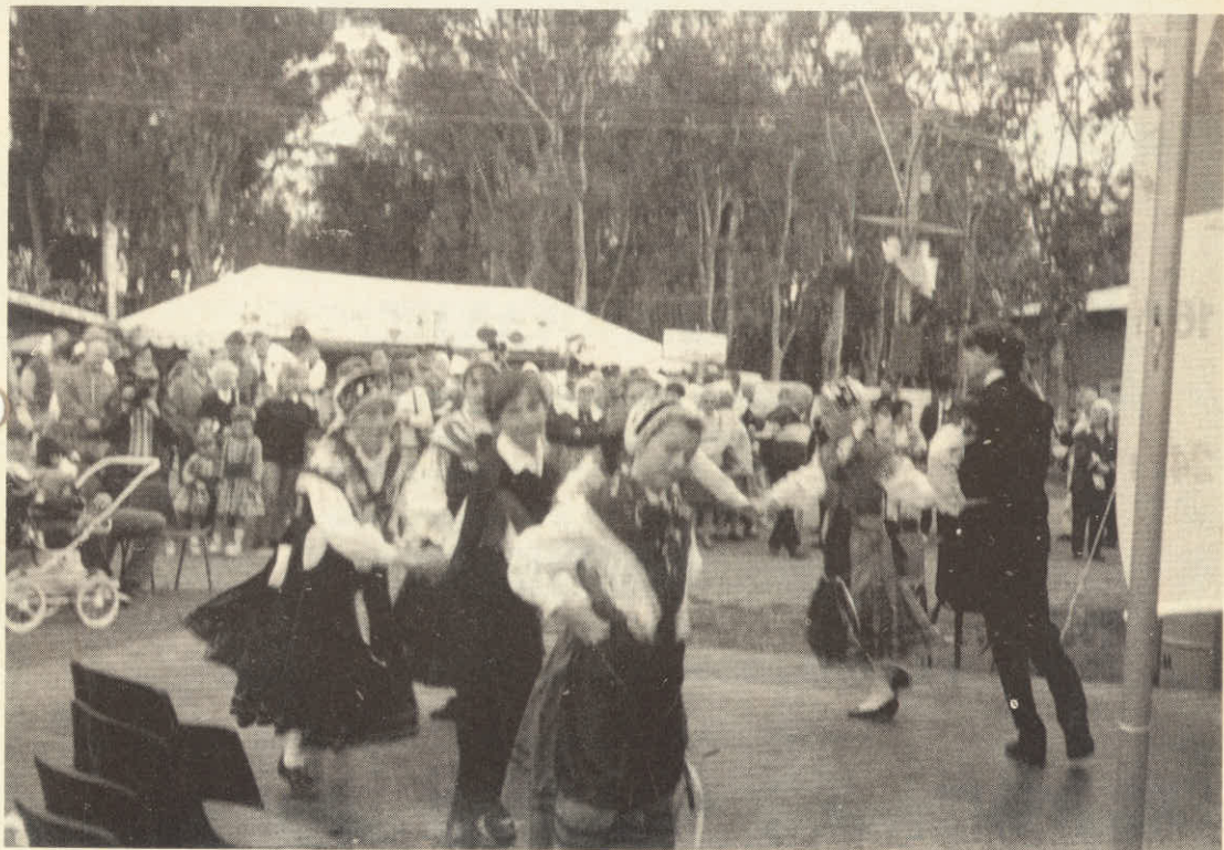
"OKTOBER FESTIVAL" DANDENONG MLADINA MLAJŠA SKUPINA.