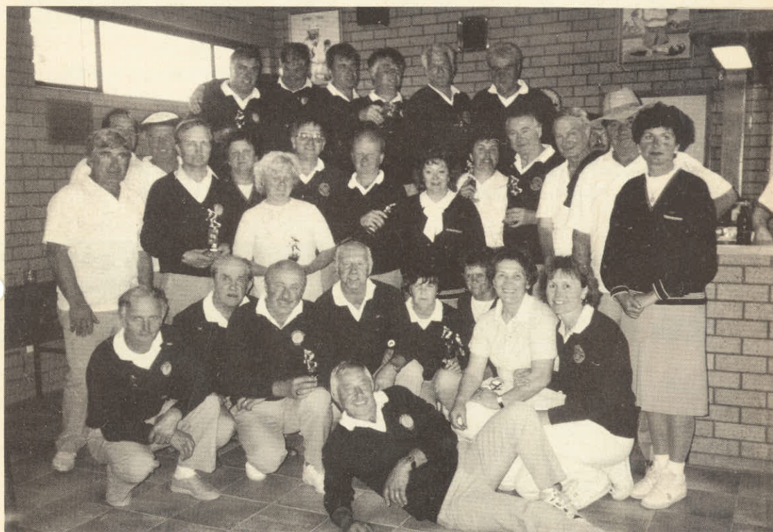
Prijateljsko balinarsko srečanje na Učki