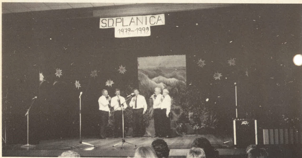
NA NOVO USTANOVLJENI "LOVSKI KVINTET" S.D. PLANICA