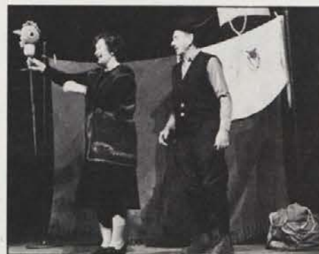
Lutkarja s pomočjo otrok sestavljata putko

Po uspešni udeležbi na Jesenicah, so ga predvajali tudi na filmskem festivalu v Beogradu, v kratkem ga bodo kazali v Sarajevu, meseca junija pa ga bodo predvajali tudi na festivalih amaterskega filma v Ebenseeju (Zgornja Avstrija) in v Monte Catinu (Italija).