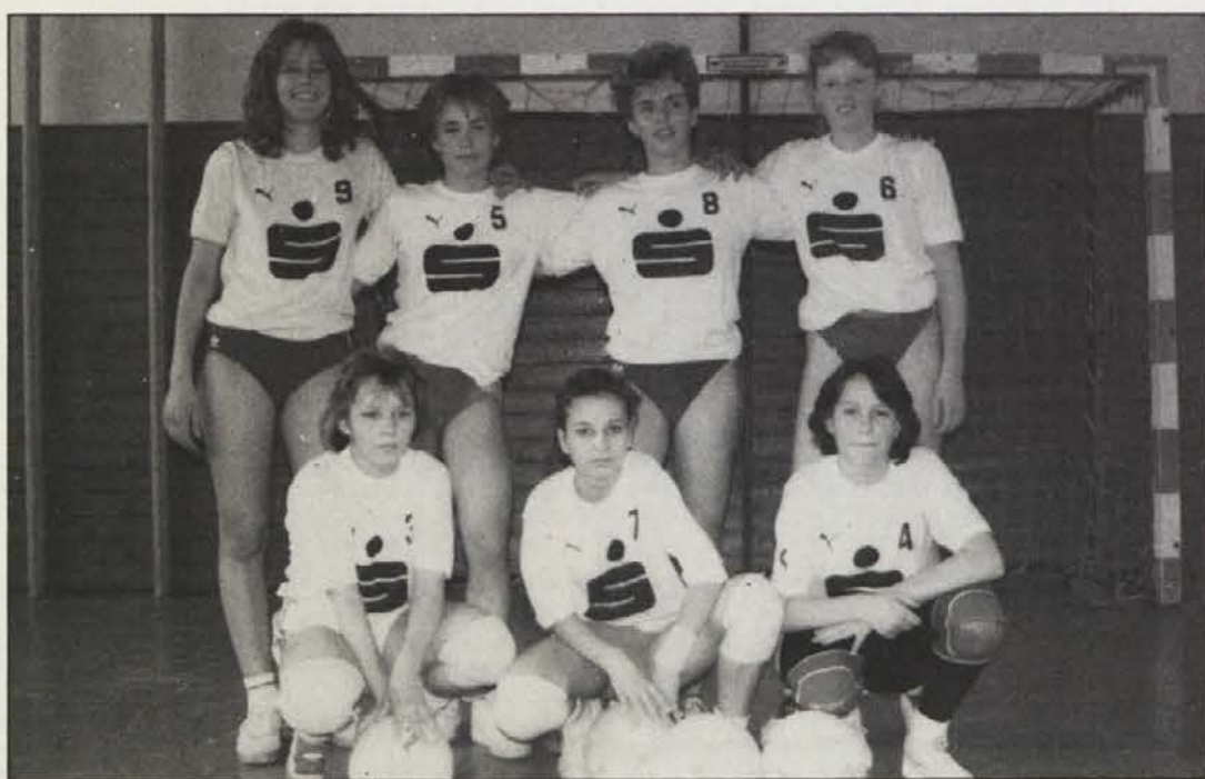
Odbojkarice slovenske gimnazije bodo v Rohrbachu zastopale Koroško.