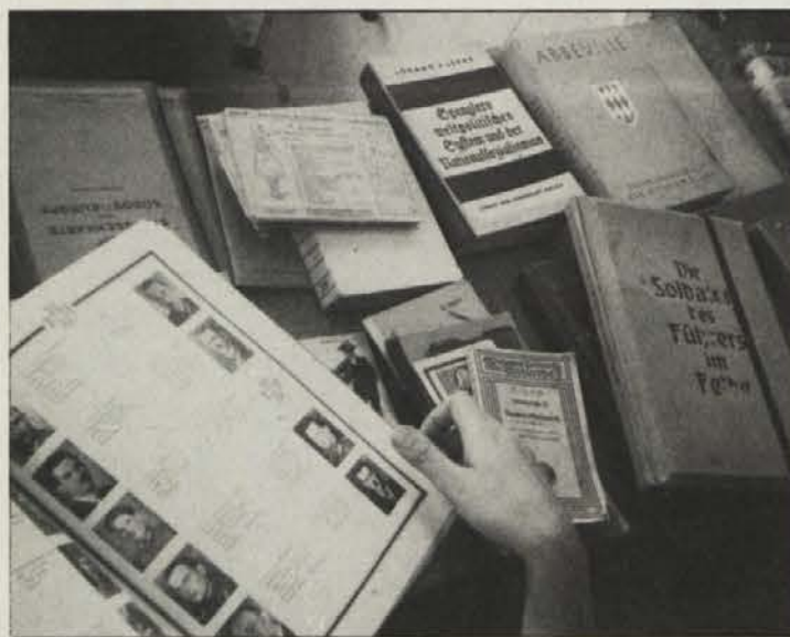
Tudi razstava „literatura“ iz polpreteklosti ni motivirala dodatnih volilcev za listo „Kristin“

Na celovski univerzi je bilo 3.430 volilnih upravičencev, volilo jih je 930 ali 27%, veljavnih pa je bilo 908 glasov. Socialistično frakcijo BKS/VSSStö je volilo 464 študentk in študentov, Aktionsgemeinschaft 242, Alternativno listo univerze 121 in JES 36. Razdelitev mandatov: BKS/VSSStö 5, AG in ALU 1. Jasna odpoved frakcij svobodnjakov pa je znamenje, da večina ne namerava prepustiti usode dežele desnemu krilu.