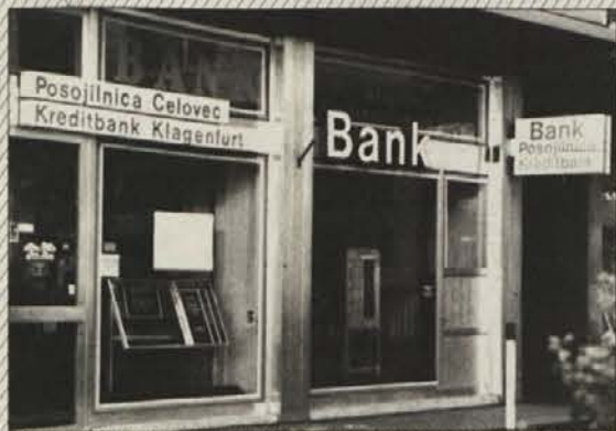
Jubilejna brošura Posojilnice-Bank Celovec vsebuje pregled stoletnega razvoja.