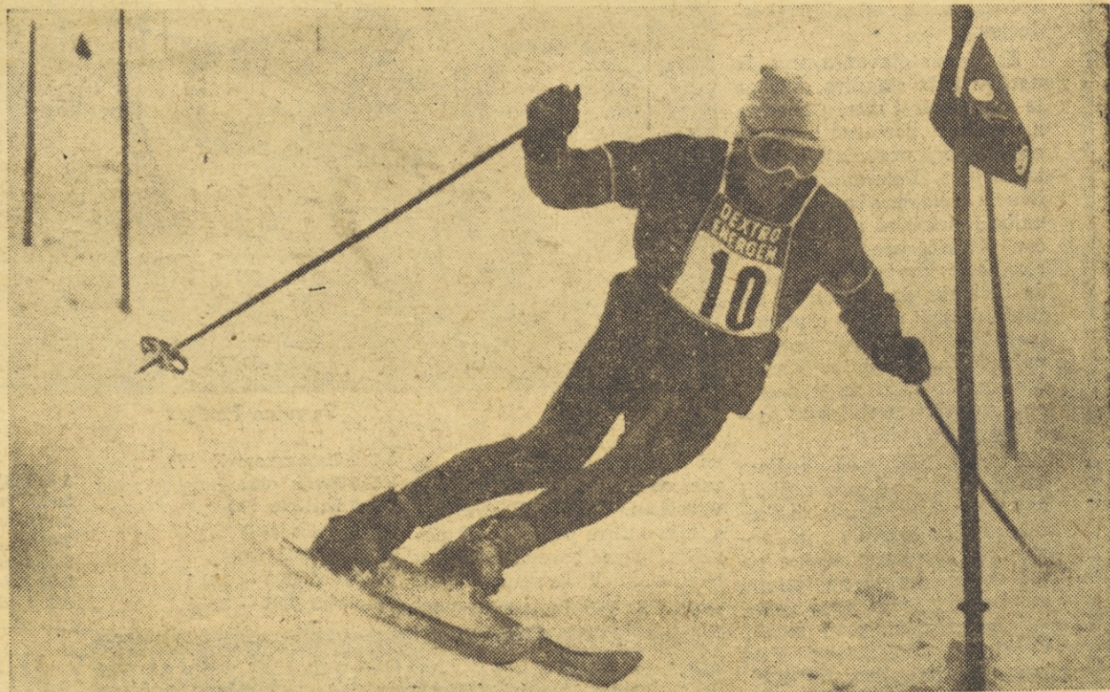
Zimmermann je, kot kaže, letos eden najbolje pripravljenih smučarjev in kot glavni kandidat za zlate medalje na olimpijskih igrah. Pa vendar, po dveh zaporednih zmagah v petek in soboto v Wengenu se mu je danes zapletlo v slalomu in moral je odstopiti. S tem je šlo po vodi njegovo zanesljivo prvo mesto v kombinaciji.