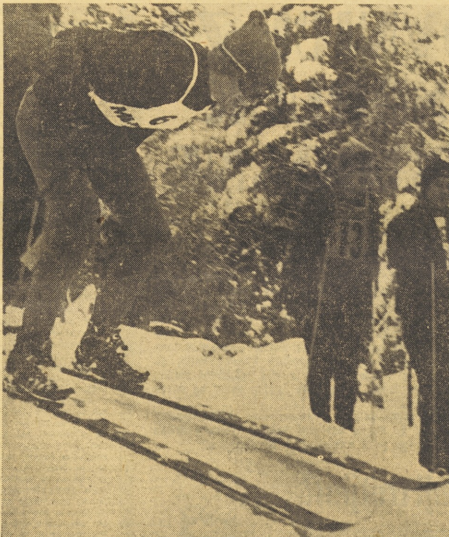
Pustoslemšek iz Mežice, ki ga vidimo na startu smuka na Pohorju, je med najboljšimi alpskimi smučarji

— Leta 1959 sem imel med tekmo težjo nesrečo, padel