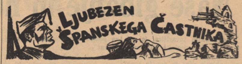
Iz francoščine prevedla K. N.

Takoj zvečer je potlej prišel sekretar iz okraja. Nastala je v žabji dolini borba za kruh. Bara je kjer koli v vasi tulila, da je največja sirota. Čipek je pred vsemi ljudmi rekel, da je volil v prvo skrinjico in je postal zdaj tudi sirota.