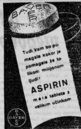
Oglas se rep. vod. št. 2272 z dne 13. III. 1935.

ALI STE ŽE PLAČALI NAROČNINO ZA »DOMOLJUBA«?