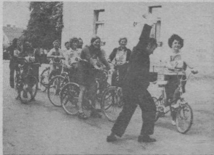
V Saturnusu pravijo: „Z rekreacijo med odmorom bomo dvignili delovno storilnost.“ Prav bi bilo, če bi se po njih zgledovale tudi druge delovne organizacije.

Medtem ko je bilo še pred nekaj leti v Ljubljani kar 5 klubov (pa tudi več), ki so tekmovali v slovenski rokometni ligi, je danes v Ljubljani edini rokometni klub, ki v slovenskem merilu nekaj pomeni: rokometni klub Slovan. Zato je povsem razumljivo, da je ta tudi iniciator vseh pomembnejših akcij za propagando rokometu v Ljubljani. Veliko pričakujejo od akcije Zimska ljubljanska šolska liga. V telovadnici visoke šole za telesno kulturo na Kodeljevem bo vso zimo tekmovalo 8 najboljših ljubljanskih šol v rokometu po liga sistemu. Vse tekme bodo ob sobotah.