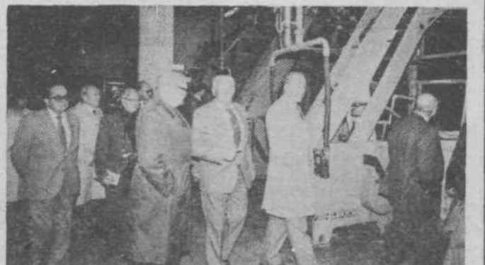
Španski borci so si na obisku v vevski papirnici ogledali tudi proizvodne prostore.

Zadnji dan so se španski borci ogledali gradnjo PST in vevsko papirnico kot pomembno organizacijo boja za delavske pravice že pred vojno, vojaško gimnazijo Franc Rozman-Stane, vojašnico Bratstva in enotnosti in Cankarjev dom. Tridnevni obisk je prehitro minil v tovariškem, prijateljskem ozračju. Nadvse zadovoljni so se španski borci poslovili od nas. AM - JK