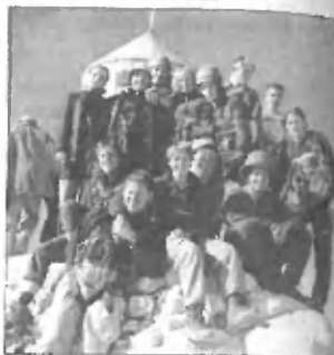
Člani MO na Triglavu

Triglav, gora, ki jo »nosijo« v srcu vsak Slovenec, nam je postregel z vsem mogočim - tudi z vnovič potrjenim dejstvom, da je gora v zadnjih desetletjih do konca razvrednotena - in da tja hodi vse več ljudi, ki tam zares nimajo kaj iskati. (EP)