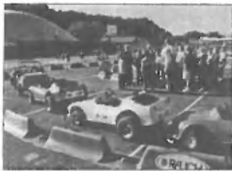
Program je prijetno popestril preventivne dejavnosti v vzgoji v cestnem prometu, ker

Društvo prijateljev mladine je Trzinem ob tednu otroka, ki je potekal pod geslom »Zdrav otrok v zdravi družini«, pripravilo več družinjen otrok in njihovih staršev. Preživeli naj bi ga čim bolj sproščeno, v duhu prijateljstva in zabave, in tako je tudi bilo.