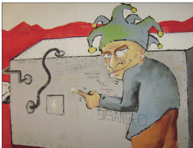
Sl. 4 Društveni centar Rojc – nekadašnja vojarna kao prostor kreativnosti Fig. 4 Centre Rojc – former military barrack as a space for creativity

Većina ispitanika smatra da se otvaranje Centra na prostoru nekadašnje vojarnе većinom pozitivno odrazilo i na kvalitetu života stanovnika gradske četvrti Monte Zaro. Uređenje prostora i dovođenje novih funkcija (na prostor vojarnе Karlo Rojc, ali i vojarnе Istarskih brigada) pridonijelo je daljnjem jačanju socijalnih, administrativnih i uslužnih funkcija gradske četvrti pri čemu je istodobno zaustavljen proces degradacije i devastacije urbanog pejzaža te je povećana vrijednost zemljišta na prostoru gradske četvrti.