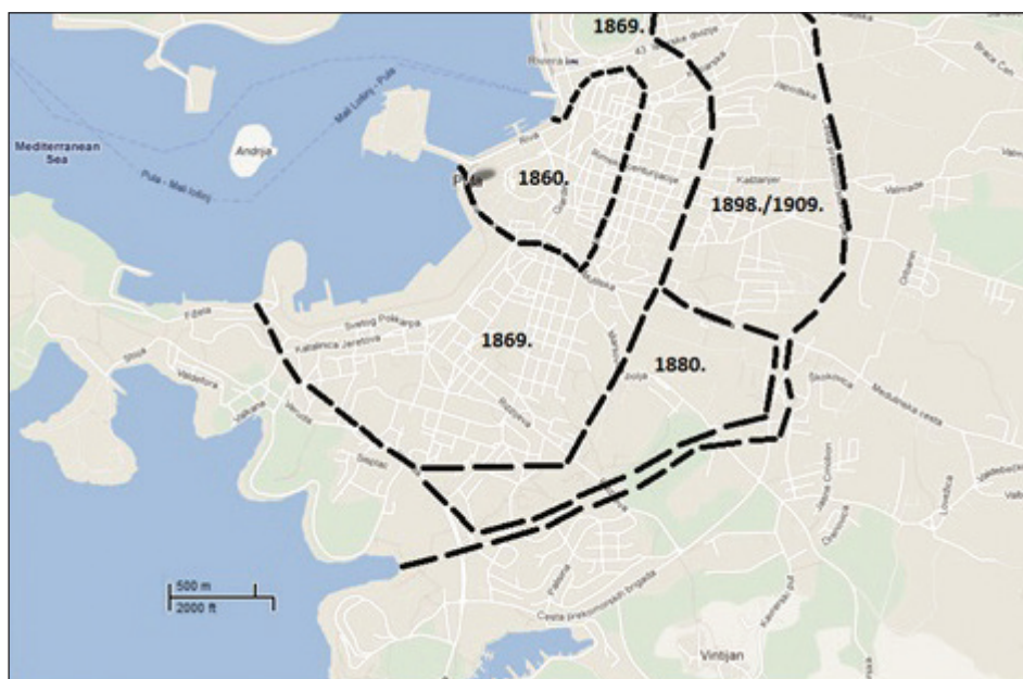
Sl. 1 Faze razvitka grada od 1860. do 1909. godine

Istovremeno s izgradnjom grada ruše se ostaci starih zidina i gradi se novi fortifikacijski sustav koji je trebao braniti Pulu kako s kopna tako i s mora. Sustav se protezao od Barbarige i Vodnjana na sjeveru do rta Kavran i Marlera na jugoistoku, rta Kamenjak na jugu i Brijuna te je obuhvaćao 28 utvrda (kula). Godine 1869. Povjerenstvo za fortifikacije određuje granicu tvrđavske jezgre prema kopnu. Godine 1908./09. oko grada se gradi ži-