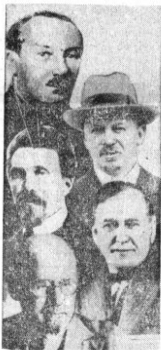
Nekaj obtožencev iz moskovskega procesa. — Od zgoraj navzdol so: Jagoda, Buharin, Rikov, Rakovski in Krestinski.

Zaradi vedno hujšega pritiska francovcev na Madrid in Teruel se je republikanska vlada