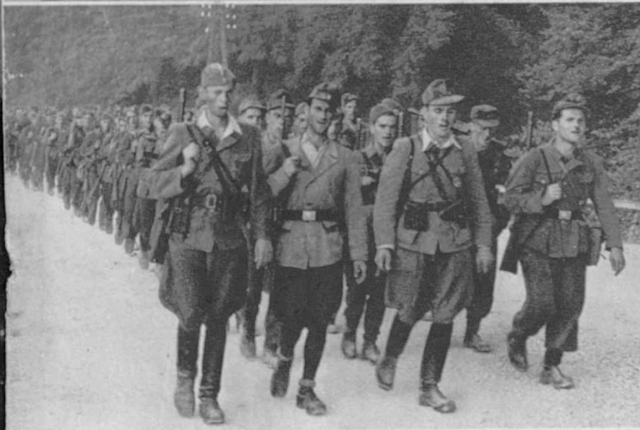
S pešmijo se fantje vračajo s pohodov Singend kehrt eine Kompanie aus dem Einsatz zurück

Zadovoljstvo in poveljnikova pohvala sta domobrancem nova pobuda za nadaljnji boj