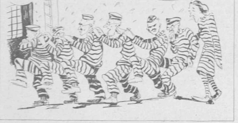
Po likvidaciji slovenskih narodnih dobrin se umika CKKPS na svoje zadnje redno zasedanje...