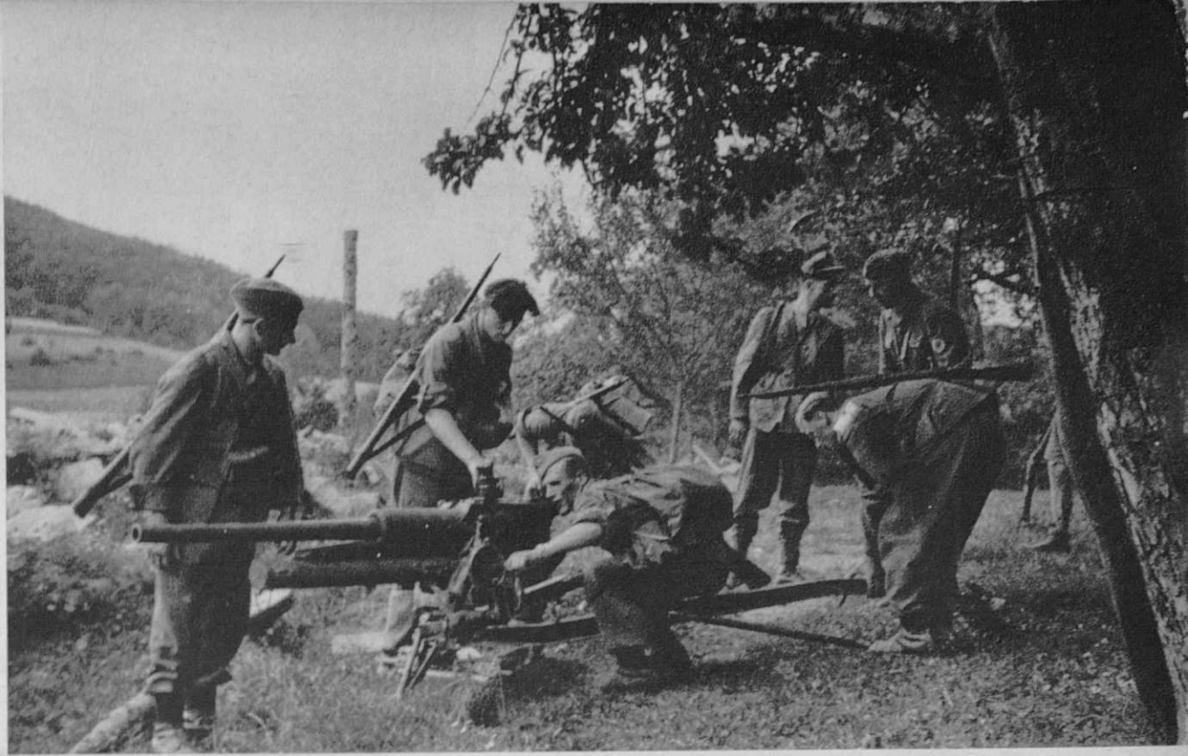
Zaplenjeni top preizkušajo Ein erbeutetes Geschütz wird ausprobiert