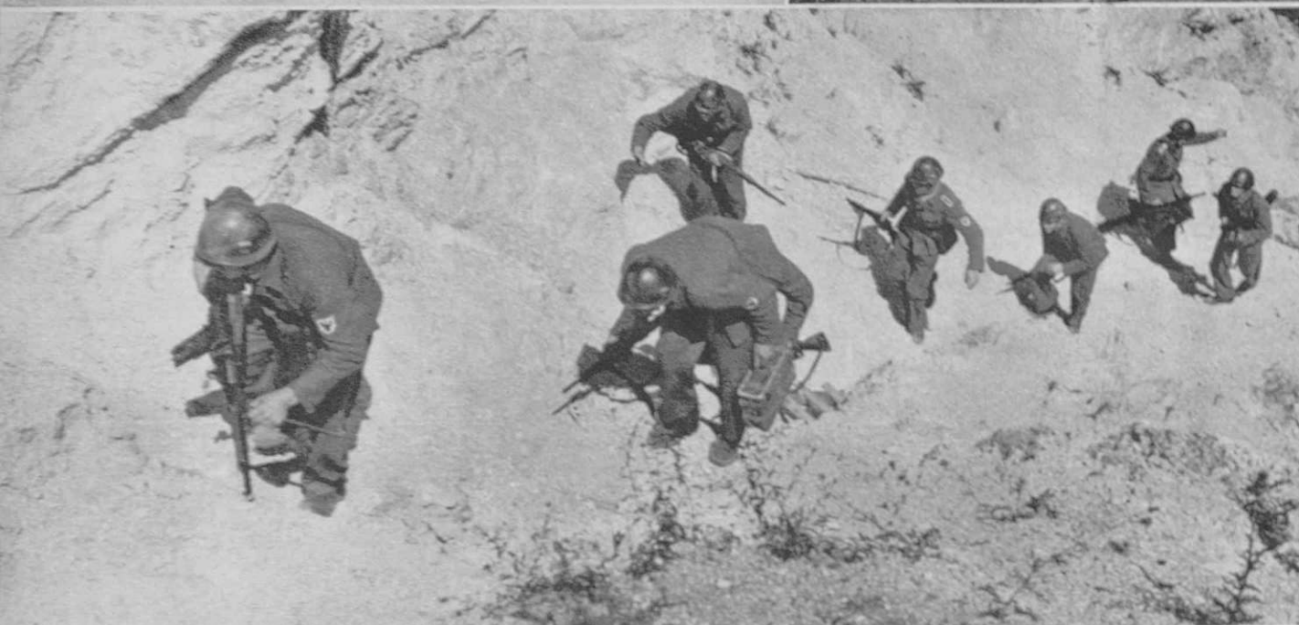
Zgoraj levo — Oben links: Udarni bataljon s poveljniki na čelu odhaja na pohod Die Einsatzgruppe mit ihren Führern an der Spitze auf dem Marsch