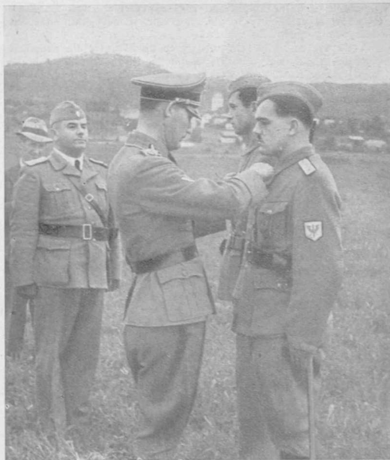
44-Obergruppenführer R ö s e n e r odlikuje slovenske častnike

Zaradi tega je italijanska cesarska vojska pustila, da se je Osvobodilna fronta leta 1941 nemoteno in javno organizirala ter nemoteno pobijala slovenske politične in druge voditelje. Osvobodilna fronta pa ni navzlic svoji propagandi izvedla vse leto 1941 ter 1942 niti enega nastopa, ki bi bil povzročil kakršno koli škodo okupatorju, proti kateremu se je baje borila.