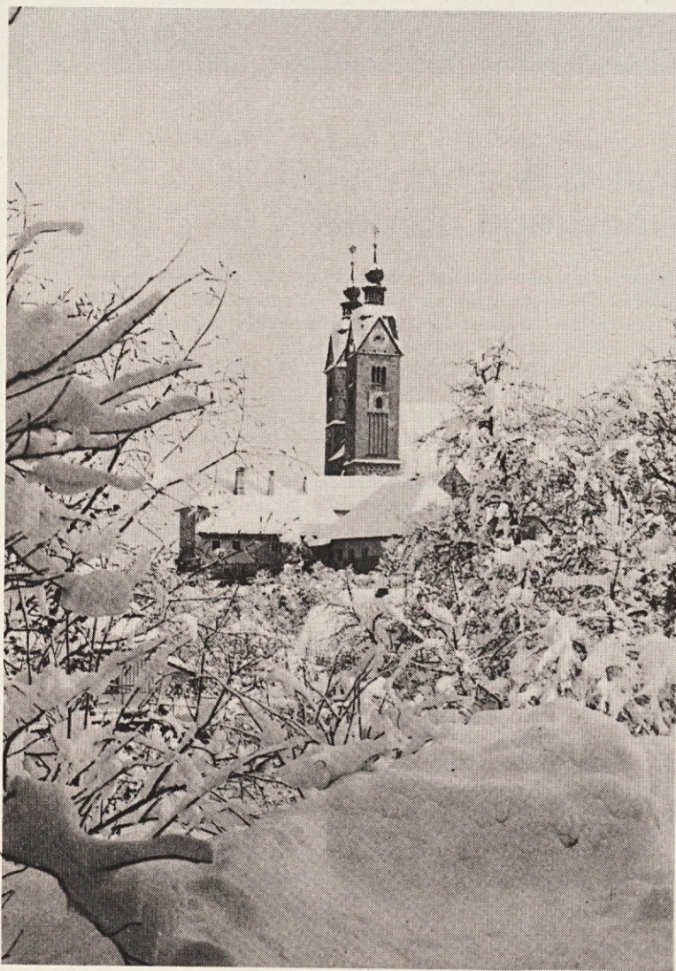
GOSPA SVETA na Koroškem, zgodovinsko središče slovenstva, slovenskega krščanstva in slovenskega Marijinega češčenja.