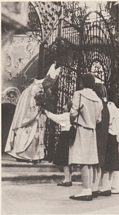
Birmanka izroča škofu šopek po pozdravu v Einsiedelnu.