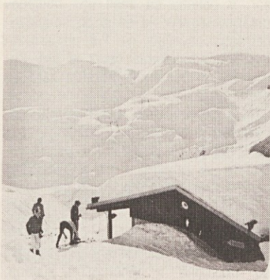
Na VOGLU nad Bohinjsko kotlino so odlična smučišča. Ob zgornji postaji žičnice sta brunarici Burja in Murka.

Udeleženci javne tribune so opozorili, da ni slab in ohlapen le kazenski zakonik, temveč tudi drugi zakoni. Omenili so zakon o javnem obveščanju, ki v enem od členov navaja, da se lahko časopis prepove, če objavlja neresnične in alarmantne vesti, ki ogrožajo oziroma bi lahko vznemirile javnost in povzročile slabo razpoloženje pri ljudeh. Po tej logiki bi morali zapleniti Delo vsakič, ko piše o podražitvah.