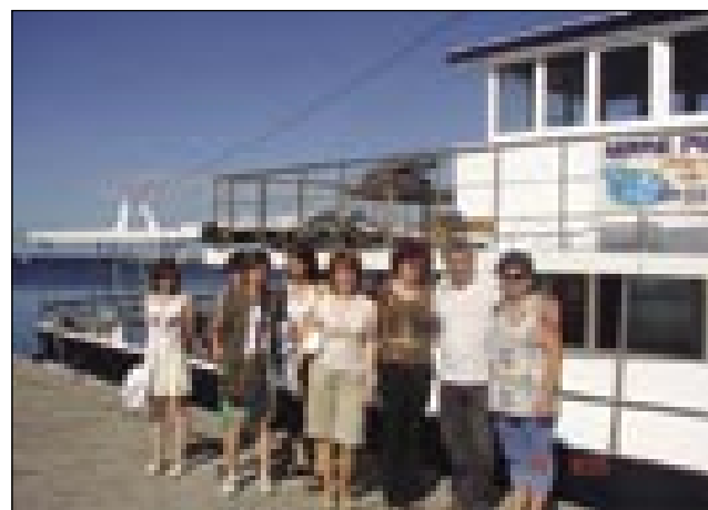
Naša skupina na izletu

okriljem dreves in vaškega zvonika, manjši oder pa je bil v šotoru nekaj metrov stran. Naša skupina je nastopala v šotoru in verjetno bi vsi z mano vred rajši okusili oder pod milim nebom, kjer vse