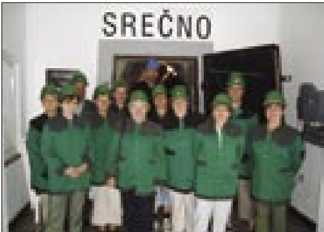
V rudniki živoga srebra v Idriji

vanjom so ešče malo spejvali tisti, šteri majo glas, mi drugi, šteri nej mamo, smo je pa samo poslušali. Kaulak pau edne je že vsakši v posteli bijo pa spau. Nej dugo, zato, ka so se edni, šteri tak spijo kak zavec, gorbribidili na grmanco. Dja sam tö čüjo, dapa tau so pravli, ka je gnauk sploj fejest črepnilo. Nika mora v tejm biti, zato ka Brašič, steri je z Lalinom v ednoj posteli spau, se je tö prebüdo. Nej samo zato, ka je zgrmalo, liki zato, ka se je Lali tak zbojo, ka ga je za šinjek zgrabo.