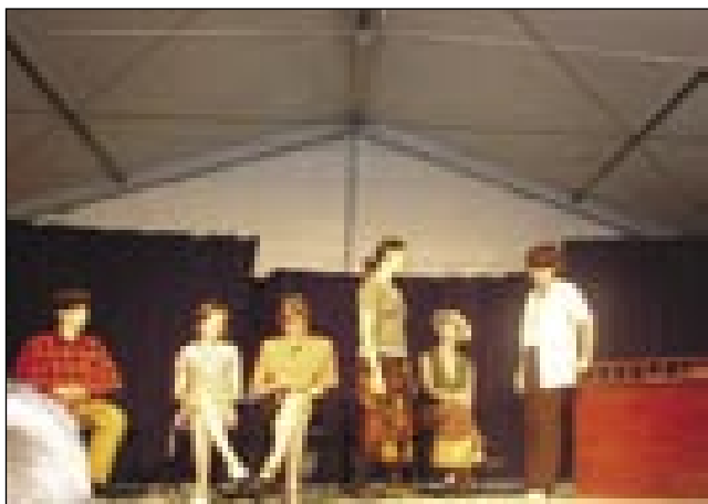
Predstavili smo se z igro v porabskem narečju »Starišov djilejš«

italijanskega sladoleda in se poslovili od naših gostiteljev. Čas je bil za odhod, odhod iz zamejske Primorske v Slovensko Porabje. Iz enega konca meje na drugi