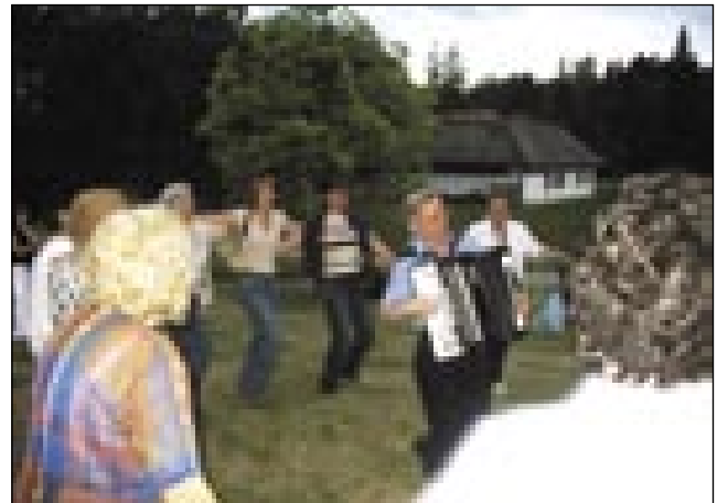
Rajanje na rajži