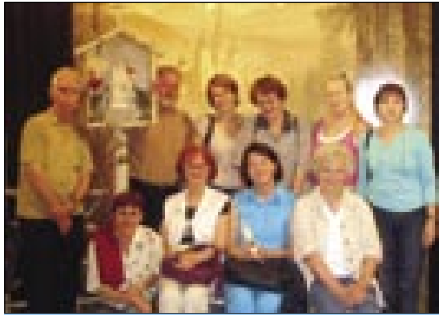
Prauškarge iz Mariazella