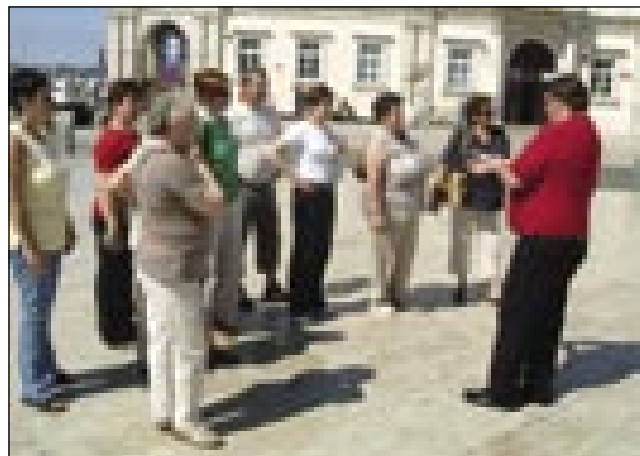
Na Tartinijevom trgi v Pirani

Most na Soči, gde smo obed meli. Gda smo se od kosila že malo zmantrali, te smo se s šiftom Lucija na panoramsko vožnjo pelali po Soškem jezeri (tó). Tak mislim, ka z menov vret dosta vse smo nej vidli iz panorame, zato ka je nas kapitan šifta skauz zabavo. Zgodbe, norije je gučo, zdavo nas je, vö nas je zvau, naj šift ravnamo, tak ka je edna vöra brž taodišla. Potejm smo znauva na autobus vseli pa prej k Nove Gorice pa Kopra smo se v Izolo pelali, zato ka v hotelu Belvedere smo spali. Tam si je vsakši vöodebro sobo pa smo meli edno vöro, naj si malo počinem, vejpa tak dosta smo