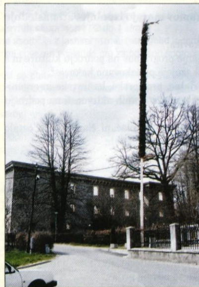
Tokrat je preserska butara merila 25 metrov.