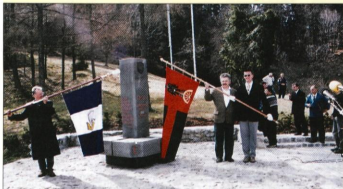
Lanska in letošnja zmagovalka - zastavi naše občine in občine Litija.

V počastitev 156-letnice prvega izobešanja narodne zastave Slovenije 7. aprila 1848 v Wolfovi 8 v Ljubljani je 3. aprila na GEOSS-u potekal že 7. prireditev ob dnevu slovenske zastave. Naša zastava ne simbolizira le zgodovine, tradicije in državnosti, temveč potrjuje uspešen boj za zedinjeno Slovenijo, ki se je pričel leta 1848.