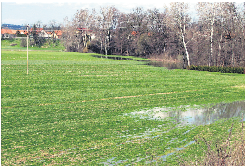
Letošnja dolga zima in deževje bosta brez dvoma zdesetkala pridelek jarih žit, pričakuje pa se tudi nižji donos pri ozimnih pridelkih.

Ocena izpada pridelka je po besedah Brodnjaka zelo različna od poljščine do poljščine: „Jarini praktično letos sploh ne bo, morda bo še ta