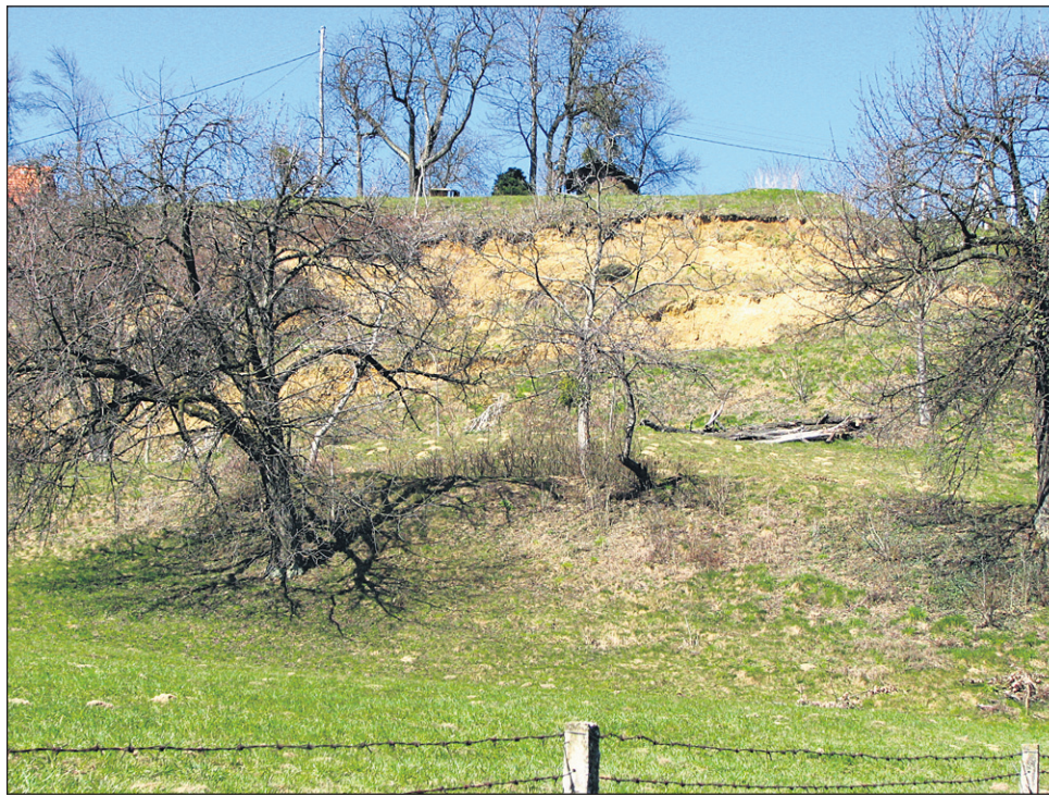
Hrib počasi drsi v dolino, s sabo pa premika dreve, vinograd in vse, kar se mu znajde na poti.