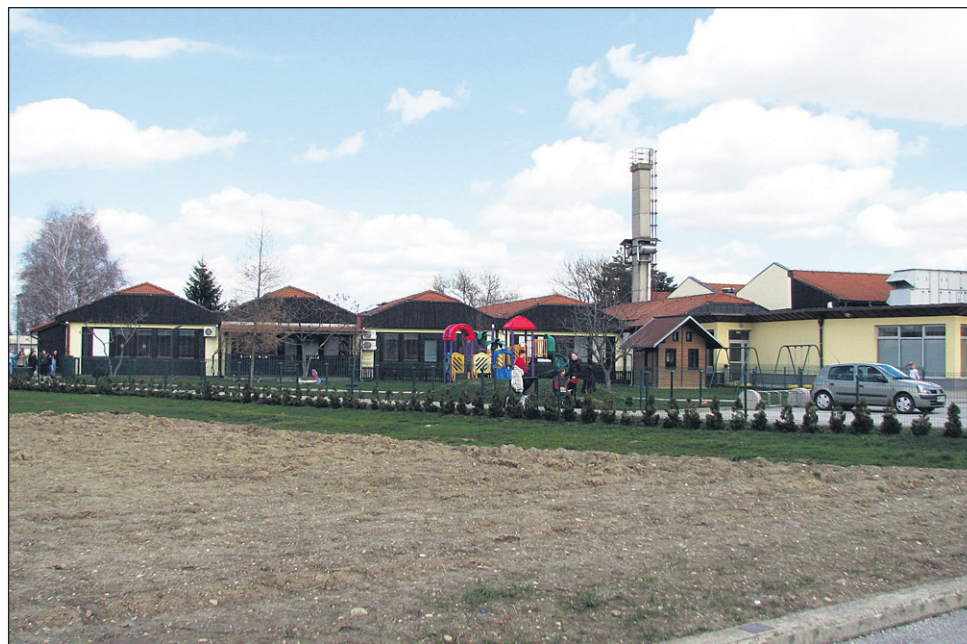
Med prvimi štirimi občinami s Spodnjega Podravja, ki so uspeli na prvem energetskega razpisu, je tudi Občina Markovci, ki bo za energetske prenovne šole prejela kar 765.000 evrov.

projektov, goriška dva, jugovzhodna Slovenija 17, koroška 9, notranjsko-kraška dva, obalno kraška 5, osrednjeslovenska 14, podravska 14, pomurska 8, savinjska 18, spodnjeposavska 7 in zasavska dva.