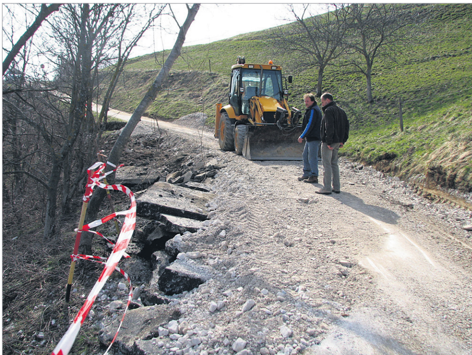
Plaz, ki je odnesel dobrih 30 metrov povezovalne ceste med občinama Videm in Podlehnik, že sanirajo.

sanirati. Sicer je nekaj plazov evidentiranih na novo, so pa predvsem posledica posegov v okolje, bodisi da gre za odstranitev dreves ali gradnje. Ocenjujem pa, da bo nekaj povsem novih plazov, ki so posledica hribovitega terena. Vsega skupaj imamo v trenutni evidenci okrog 8 do 10 takih lokacij. Veliko posegov in drsenja zemlje je na naših cestah, zlasti v Gradiščah, Okiču, Slatini, Paradižu in Brezovcu, kakšen obseg škode in področja zajemajo, pa je odvisno od terena, na katerem so se pojavili. Nekaj od teh plazov je takšnih, da jih ne bo problem sanirati, enega bo sanirala Direkcija RS za ceste; gre za plaz v Okiču, verjetno bo pa tudi kakšen plaz, ki ga občina z lastnimi sredstvi ne bo zmo-