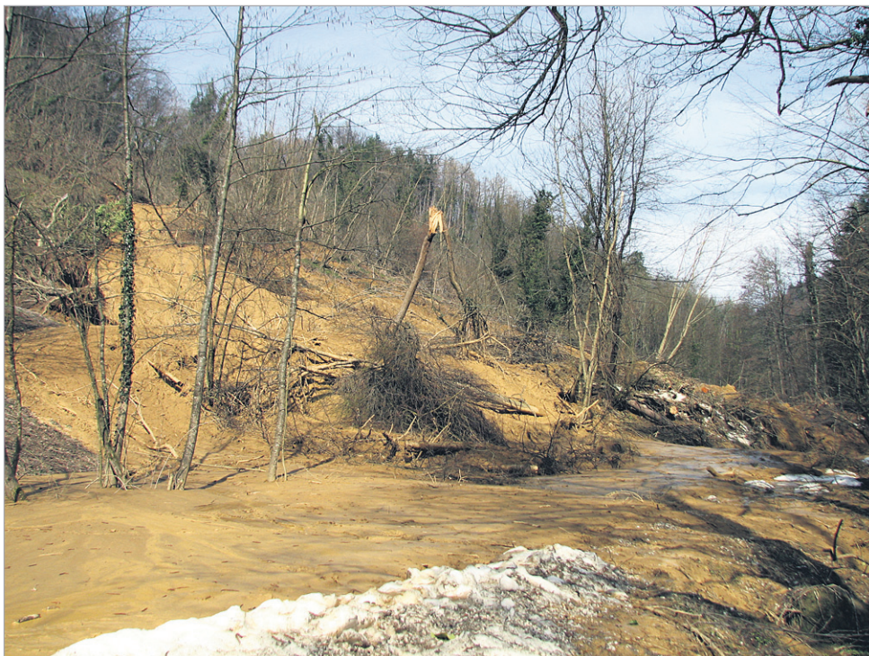
Eden največjih plazov je v občini Podlehnik; na cesti Kozminci-Zg. Gruškovje se je zvalila ogromna gmeta blata in drevja s celotnega pobočja; po ocenah bo treba odpeljati okoli 7000 kubičnih metrov materiala.