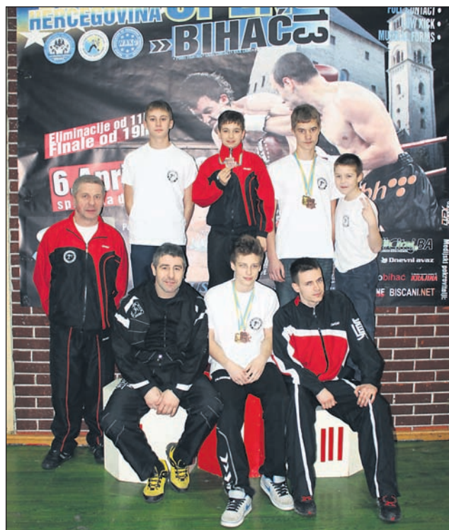
Člani KBV Ormož, ki so nastopili v Bihaču

V soboto, 6. 4., je v Bihaču v kikboks, Bosna in Hercegovina open 2013. Tekmovalo se