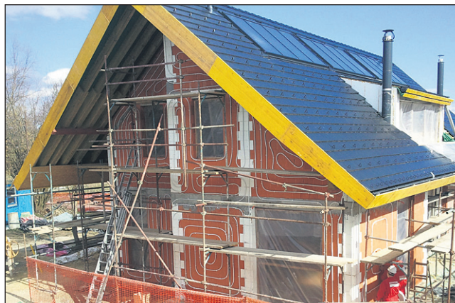
Hiša iz opeke porotherm in s sistemom Solinterra bo za ogrevanje, pohlajevanje in prezračevanje porabila manj kot 10 kWh/m 2 na leto.