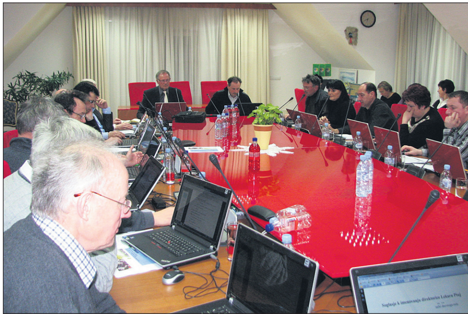
S prvim rebalansom letošnjega proračuna so svetniki potrdili tudi najem novega polmilijonskega kredita.

ka 17.000 evrov, če jo hočemo dokončati, za avtobusne postaje, ki že stojijo, je prav tako treba plačati račun, nujno je potreben nadstrešek za strojno opremo našega režijskega obrata, kar je dodatnih 15.000 evrov, za krpanje razpok in lukenj na cestah manjka 10.000 evrov, veste pa tudi, da smo krepko prekoračili sredstva, predvidena za letošnje pluzenje. Za izvedbo komunalne infrastrukture v obrtni coni, ki je prijavljena na razpis regionalnih razvojnih programov, od koder bomo prejeli lep kos potrebnega denarja, pa moramo tudi zdaj zagotavljati svoj delež v višini 350.000 evrov, prav tako tudi moramo zagotoviti svoje del denarja za energetsko prenovo šole, kjer smo že dobili pozitiven sklep za sofinanciranje.“