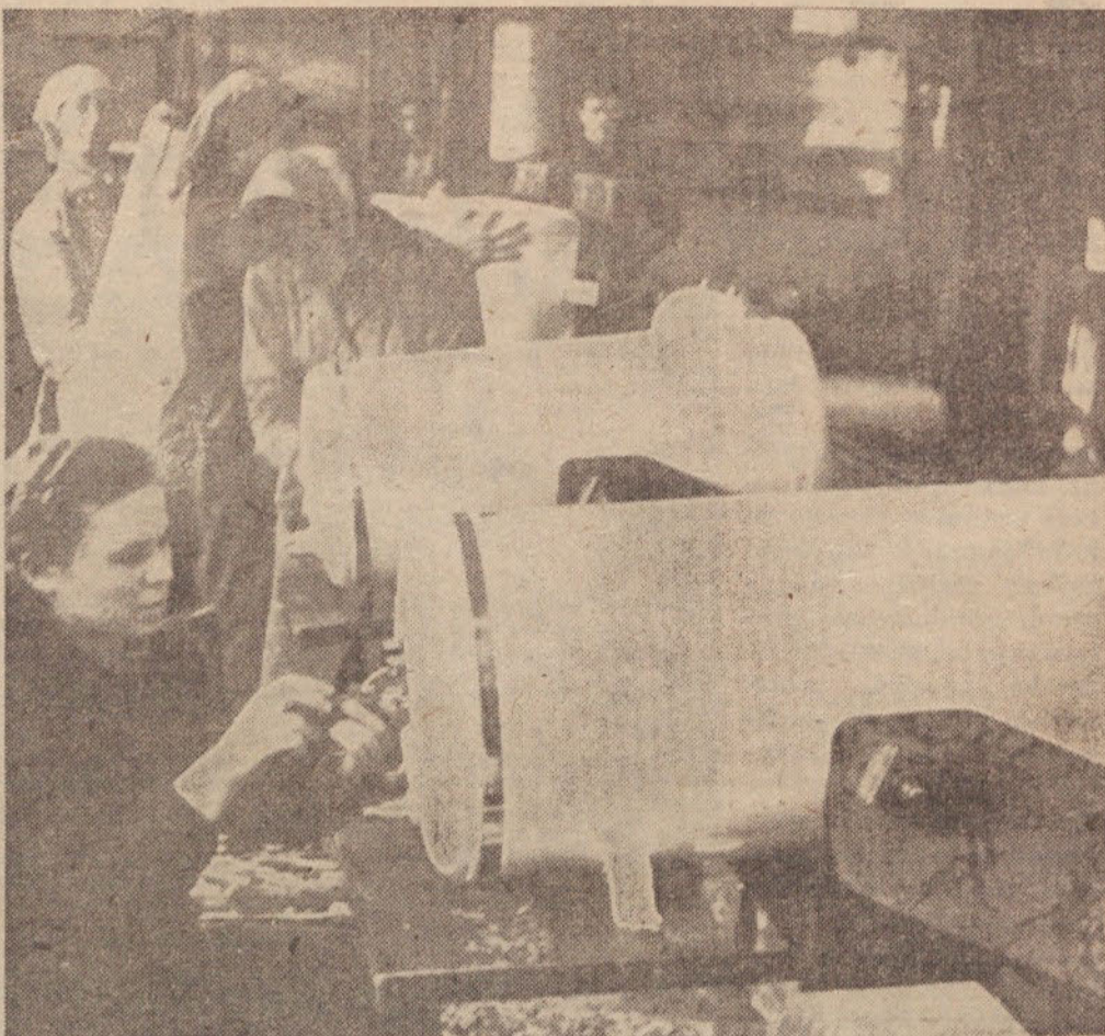
Po rekonstrukciji bo vedno več TIKI boilerjev

Skupna vrednost investicij za obrat Agrokombinata v Vodichah bo predvidoma 192,5 milijonov din. Največ sredstev bo porabljenih za zgraditev odprtih lesenih hlevov, za zgraditev mlekarnice za 600 krav, za zunanjo ureditev ter upravno poslopje z vratarnico. Preostalih 54 milijonov dinarjev bodo porabili za gradnjo trafo postaje, vodovoda ter kanalizacije. Vse investicije bo podjetje krilo iz posojil. Kmetijska zadruga Sentvid bo predvidoma investirala 40 milijonov din za razširjeno reprodukcijo in dograditev hlevov.