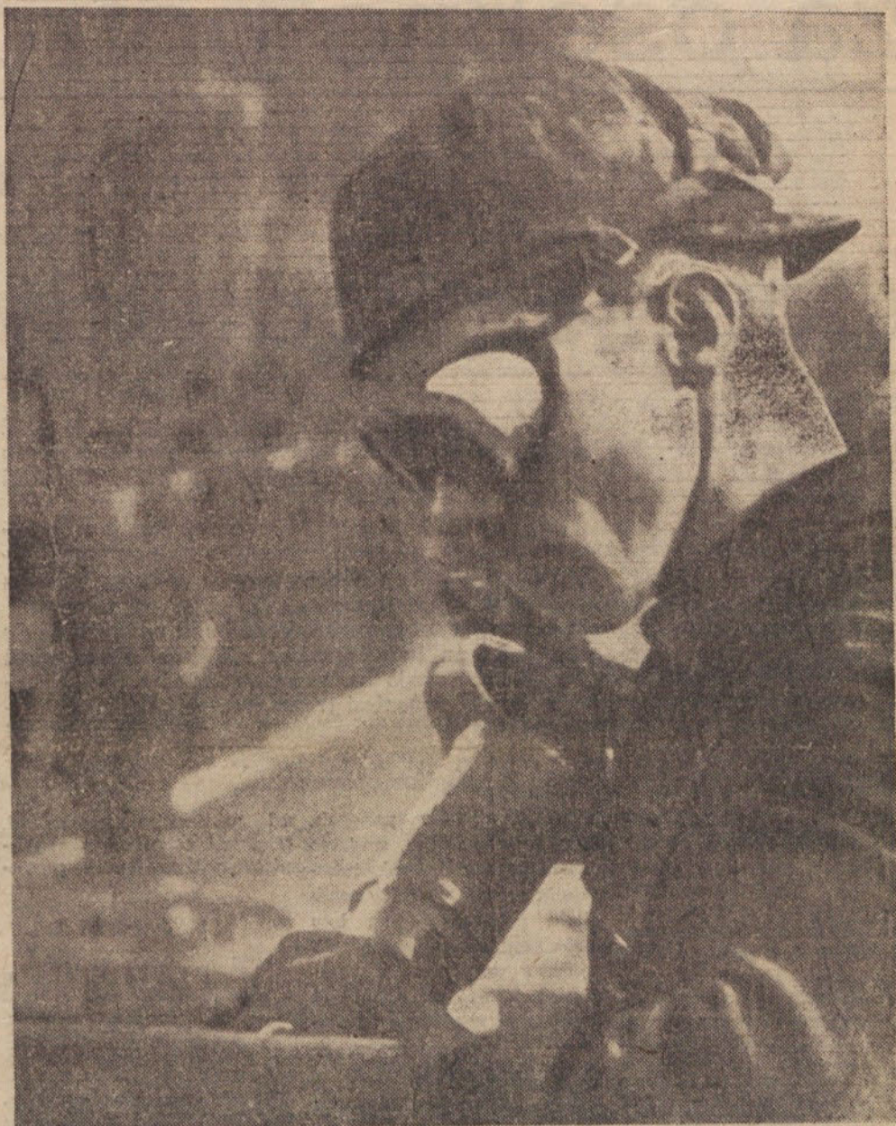
Na delovnem mestu

In na koncu: naj ponovim zahtevo, ki jo sicer nenehno ponavljamo, pa ne sme biti le propagandno geslo: v razpravah o načrtih bodimo vedno potrošniki in proizvajalci hkrati. Prepogosto namreč pozabljamo znotraj tovarniških zidov, da je od naših proizvajalskih uslug odvisno, kako bodo uresničene naše potrošniške želje in zahteve, in obratno, v razpravah na terenu v svojih zahtevah, željah in kritiki včasih pozabljamo, da pišemo na naslov gospodarske organizacije, v kateri smo zaposleni.