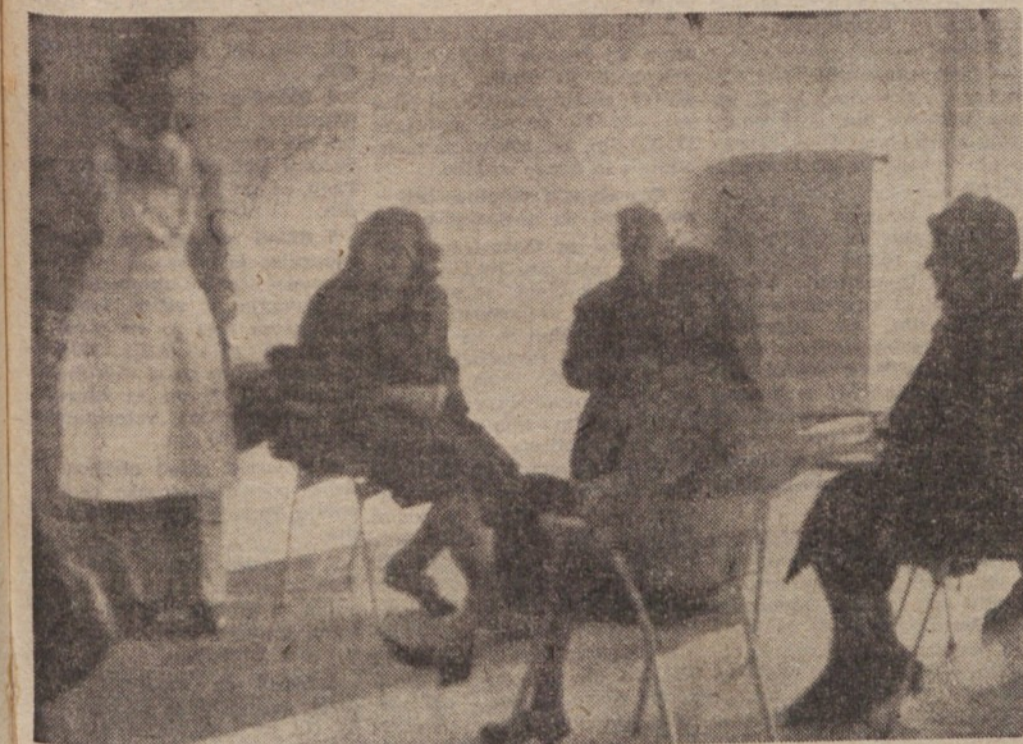
»Najprijetnejše« prostor v Zdravstvenem domu: čakalnica

Mimo tega predvidevamo, da bo Elektro Ljubljana-mesto s svojimi sredstvi izvedlo naslednje investicije: trafo postaja (v nadaljnem tekstu TP) (Na Jami), TP pri mestnih blokhi v Runkovi ulici, TP Obirska ulica, TP Djakovičeva ulica, TP Dolomitska ulica, TP Scopoljjeva ulica, projekti za RTP 35 in kabelska povezava Gospodine ulice z občinsko stavbo. Skupna vrednost teh investicij bi bila 75 milijonov dinarjev.