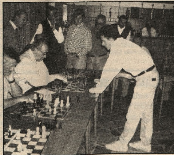
Mednarodni mojster Aljoša Grosar med simultanko.