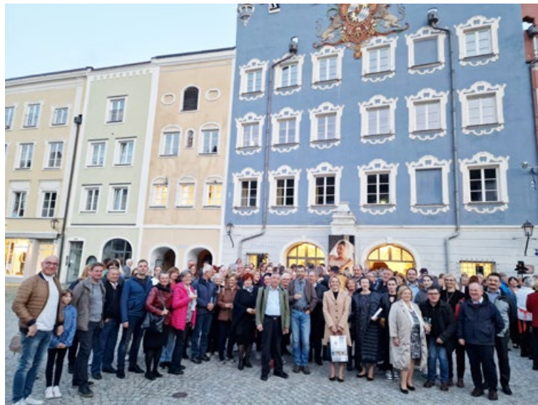
Številna ptujška delegacija v Burghausnu