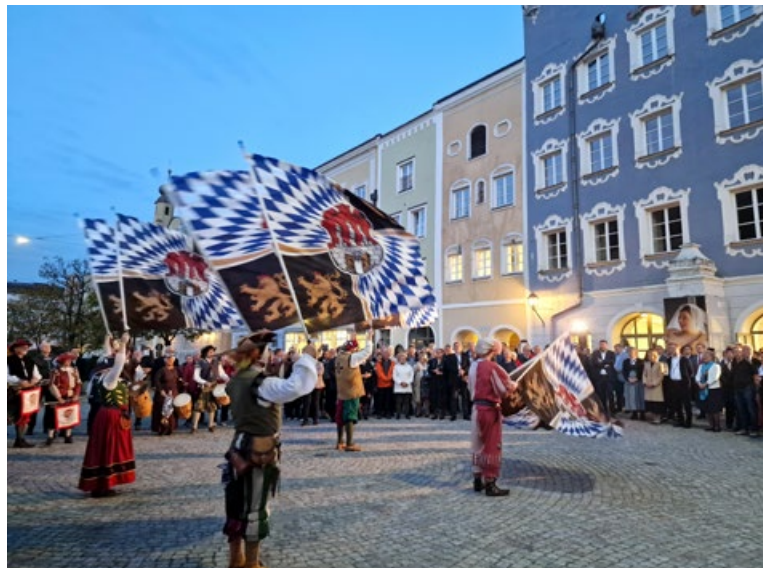
Srednjeveško obarvani kulturni program na glavnem trgu pred mestno hišo