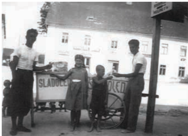
Otroško veselje ob sladoledu nekoč