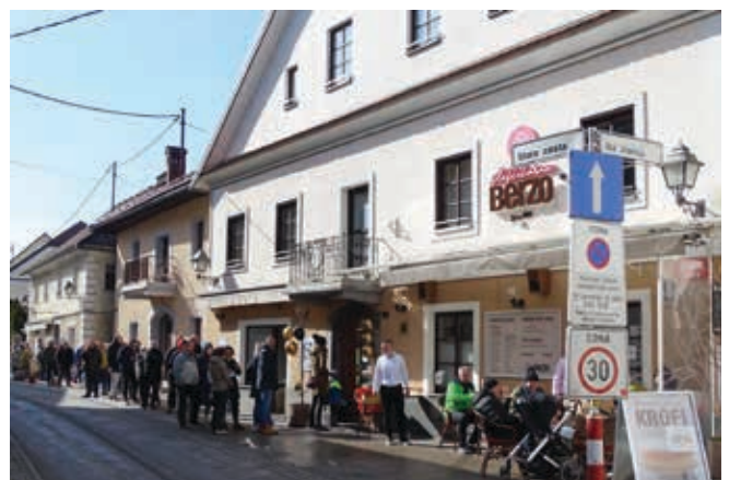
Dolga vrsta čakajočih na Najkrof 2022

Krofe pečemo že pol stoletja, petdeset let. Stranke jih rade naročajo. Sekretarka OOO Adela nas je opozorila na razpis,