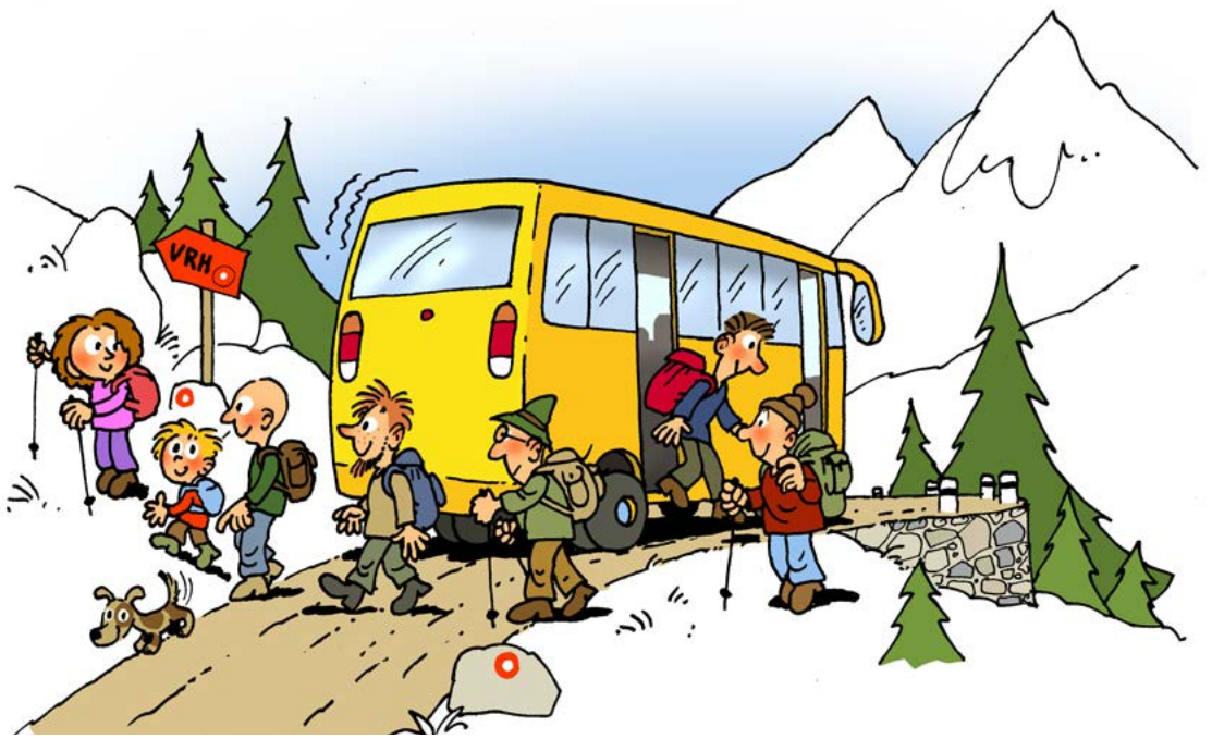
Odlično prevozno sredstvo Ilustracija Samo Jenčič (iz zloženke V hribe z javnim prevozom)

škem postajališču, do koder se lahko pripelje z avtom ali morda s kolesom. V nekaterih primerih pa lahko javni promet koristno uporabimo za pot med končno točko izleta in izhodiščem ter se tako izognemo vračanju s hriba po isti poti. Marsikje v Sloveniji je na voljo samopostrežni sistem izposoje koles, v Savinjski dolini se tako na primer lahko odpeljemo s kolesom do Polzele ter nadaljujemo peš na Goro Oljko.