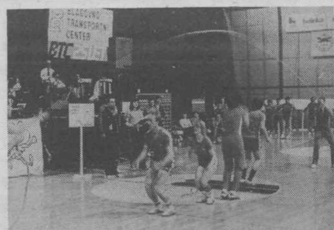
Ena od disciplin je bila tudi skakanje čez vrvi.