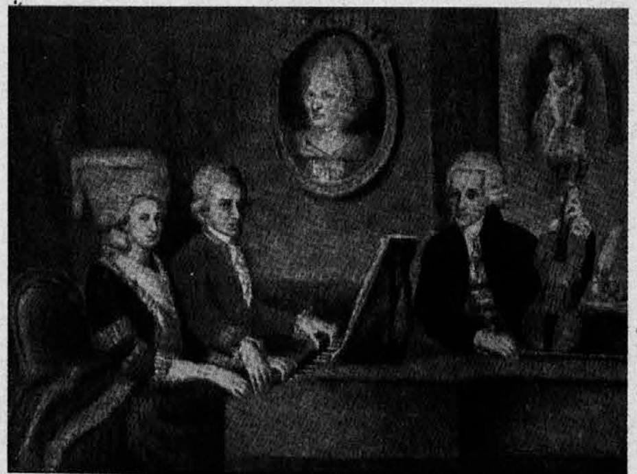
DRUŽINA MOZARTOVH — NA STENI VISI PODOBA UMRLE MATERE

mesecev življenja. In kakor da bi to slutil, se vrže v komponiranje z vso energijo, ki mu še preostaja. Dá nam blesteče kompozicije kot so: fantazija v f molu, kvintet v es (imenovan K. žgoljenja ptičkov), andante v f, adagio in Rondo v e molu, zadnji koncert v hes za klavir in orkester, nesmrtni spev »Ave verum corpus«, 4 glasben z orkestrom in orglami. Zadnja opera pa, ki jo je končal 4 mesece pred smrtjo, je »Carobna flavta« v 2 dejanjih. Ta opera ni samo dovršeno delo, ampak tudi najlepši primer nemškega Singspiela. V njej najdemo najbolj veren prikaz vseh njegovih mladostnih sanj, vsega njegovega trpljenja in pa neomajnega zaupanja v Boga. Mozart je tukaj že pravi romantik. Neke francoski kritik pravi: »Vse, kar bo doprinesla h glasbeni umetnosti romantična opera, bo imelo svoj izvor v tej operi.« In dostavlja: »Bistvo vse glasbene umetnosti je zgosteno v tej čudoviti operi: od stroge Bachove polifonije pa do moderne barvitosti Debussy-ja.« Opera je doživela