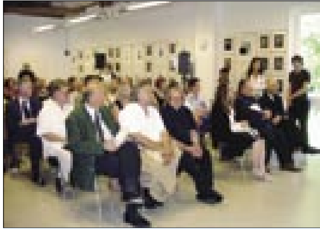
Ugledni gostje in domačini na prireditvi v Pavlovi hiši

Med govorniki je bil tudi namestnik deželnega glavarja Štajerske