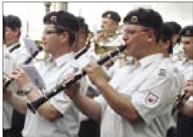
Orkester Slovenske vojske

nili, sprvoga so nej streljali. 27. junija do podneva so steli jugoslovanski sodacke nazajvzeti slovenske grajnco. Iz jugoslovanske kasarne v Murski Soboti so se pelali sodacke prauti grajnco v Dolgi vasi, na