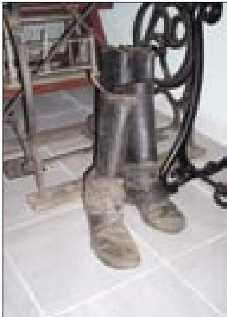
Stare čizme, bataši pri Kozicevih v Ivanjševcih

Gnesden je nej žmetno nouve punčuke (čevlje) ali črejlle (škornje-bataše, čizme) kúpiti. Boute, v šteraj takšo rastejo hitrej kak grbanji po dežji. V preteklosti in v časi našij dedekov pa babic je tou ovak bilou. Eden par je več dicé en za ovin ta ponosilo. Tüdi dobrij šujstrov nej tak dosta bilou, najšo si jih pa leko skoron v vsakšoj vesi. Gnes jih pa že skoron več nega. Vsi dobro poznamo Rogašovskoga Kisilaka , šteri je vendar najbo-