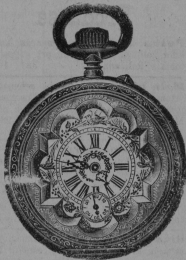
Srebrna remonter ura gld. 3.50 s posebno močnim in najboljšim kolesovjem gld. 5.50.