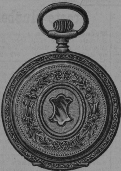
Srebrna ura z dvoj. pokrovom gld. 5.— s posebno močnim in najboljšim kolesov- jem gld 7.50,

Glavna prodajalna: Gosposka ulica št. 5, — filijalki: Tegetthoffova ulica št. 27 in Koroške ulice št. 7.