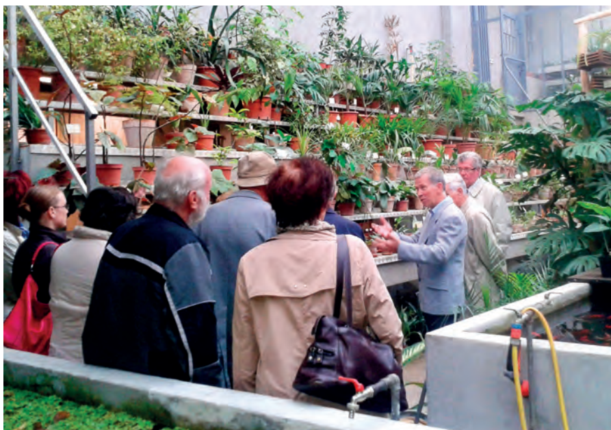
Člani SAZU so obiskali Botanični vrt. / SASA Members visited the Ljubljana Botanical Gardens.