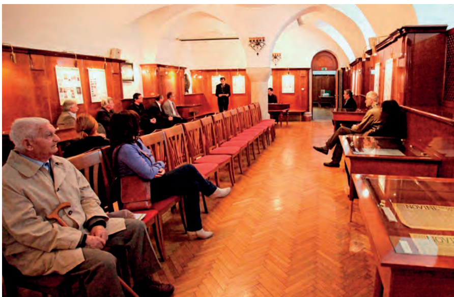
Aprilska otvoritev razstave o prekmurškem listu Novine v Prešernovi dvorani SAZU / The opening of the April exhibition on the Prekmurje newspaper Novine at the SASA Prešeren Hall.