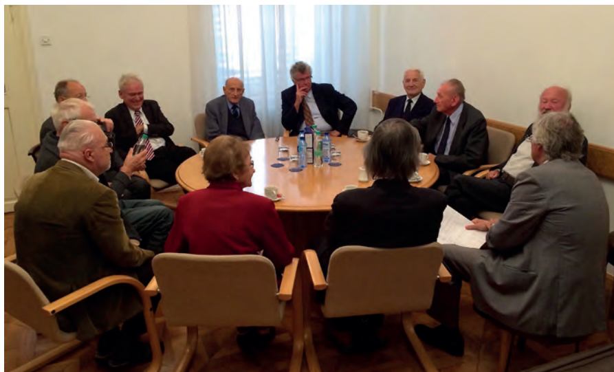
O aktualnih vprašanjih Akademije se člani, upokojenci vsak mesec pogovarjajo tudi na neformalnih srečanjih. / Retired Academy Members informally meet on a monthly basis to discuss current issues.