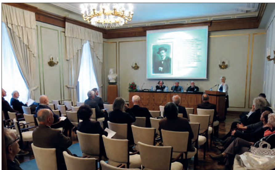
Dvodnevni novembrski simpozij Humanizem in humanistika / The two day November conference Humanism and the Humanities /