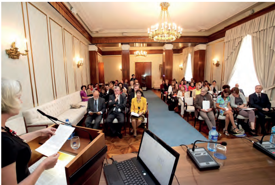
Dobro obiskani posvet Perspektive odgovornosti, etike in spolov: nova razmerja v znanosti / The well-attended conference Ethical Accountability and Gender Perspectives: New Relations in Science