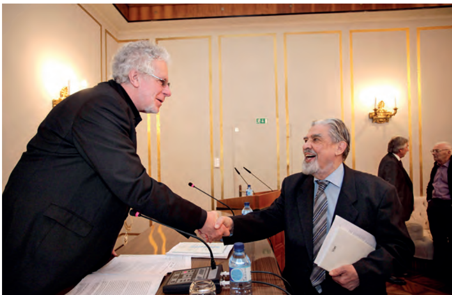
Novemu predsedniku akad. Mušiču je ob izvolitvi čestital tudi akad. Ciril Zlobec. / Acad. Ciril Zlobec congratulating the new SASA President, Acad. Mušič /