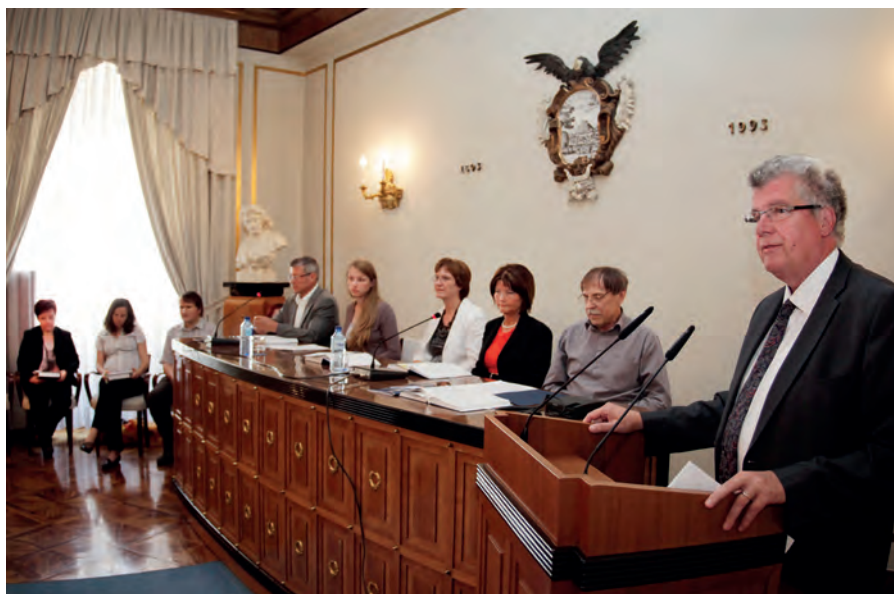
Posvet Staranje v Sloveniji / Conference Ageing in Slovenia