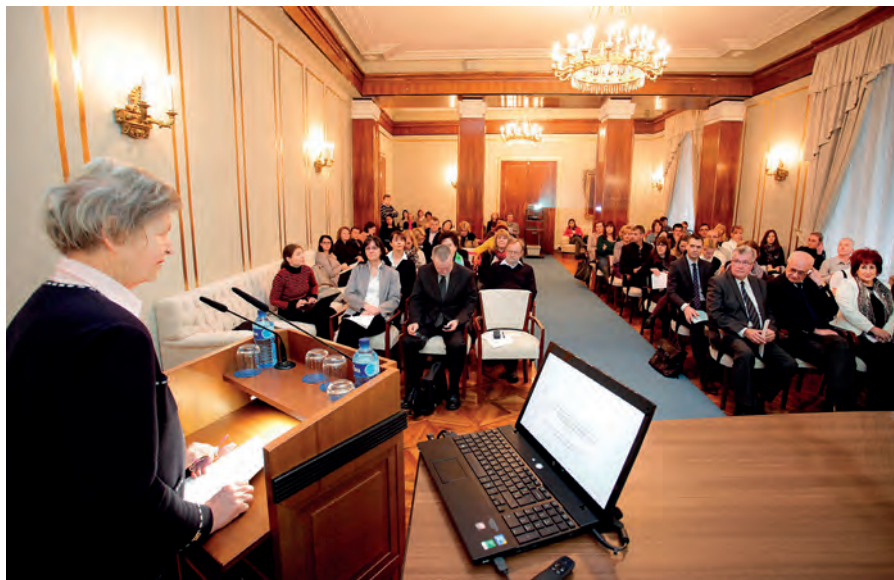
Akad. Alenka Šelih pred uglednimi gosti na posvetu o otrokovih pravicah v Sloveniji / Acad. Alenka Šelih with several prominent guests at the conference Children's Rights in Slovenia – 25 Years After the Adoption of the United Nations Convention on the Rights of the Child