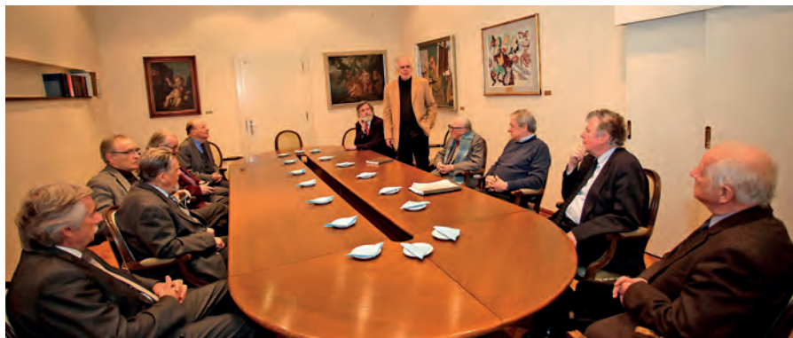
Jubilejno srečanje članov umetniškega razreda z najstarejšim članom SAZU, stoletnikom akad. Borisom Pahorjem / Festive session of Members of the Section of Arts with the eldest SASA member, centenarian Acad. Boris Pahor