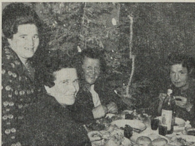
Veselo razpoloženi upokojevci na tradicionalnem srečanju v naši menzi.