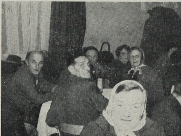
Posnetek s tradicionalnega sestanka z našimi upokojenci.

Predenje z istočasnim mikanjem obeh komponent. Vlakna obeh komponent ne vsebujejo nečistoč, zato čiščenje vlaken odpade in ostane samo rahlanje. Mešanico pripravimo tako, da posamezne komponente