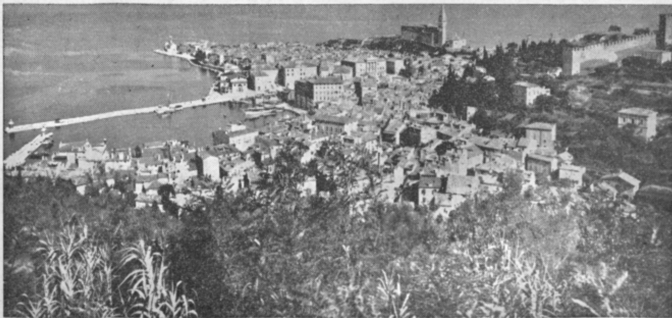
Slikovita panorama slovenskega obmorskega letovišča — Pirana

nivo, ki bi lahko čimprej ustvaril pogoje za razvoj sodobnega turizma. Prav zato se zalagajo v piranski občini, da bi kot izrazito turistična občina dobila poseben status, ki bi omogočil, da bi ostalo občini več sredstev kot doslej za kritje osnovnih potreb in za nadaljnji razvoj turizma.