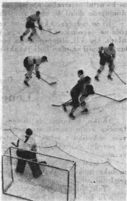
»Hoki« tekma na ledu.

16. februarja so se vršile zaključne olimpijske svečanosti. Predsednik mednarodnega olimpijskega odbora, ustanovitelj novodobnih olimpijskih iger, je izročil zaslužnim tekmovalcem za dosežene uspehe odlikovanja. Prvi zmagovalec je prejel zlato, drugi srebrno in