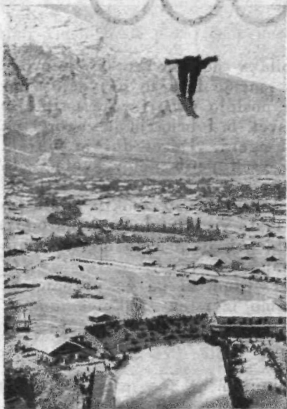
Garmisch-Partenkirchen, kraj zimske olimpijade. Skakalec — ptič.

dospeti na cilj. Med patroljnim tekom moštvo tudi strelja na mestih, kjer je strelišče. Vsi tekmovalci morajo biti tudi dobri strelci. Le tako so mogli Italijani doseči prvo mesto, čeprav so Finci in Švedi bili boljši v teku.