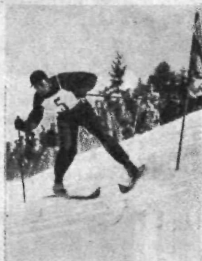
Olimpijski prvak v slalomu.

Slalom je tekma v smučskih likih. Višinska razlika je bila le 200 m, vendar je dolžina znašala 600 m, ker se je vila proga v cik-caku po zelo strmem in hudem svetu. Tekmovalci so morali smučati skozi vratca, označena z zastavicami. Zastavice so bile razvrščene tako, da so presmučali to progo le najbolj spretni slalomci! Mnogi so v preveliki brzini zgrešili vratca, drugi pa so izgubili na času, ker so bili prepočasni. Zmagal je Nемец, ki se je vil kakor kača med 25 vratci. Sijajna izvedba likov in dober čas sta mu priborila prvo mesto.