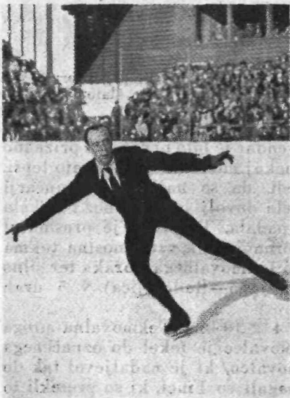
Umetno drsanje. Tekmovalec izvaja ibr. odsl drsalne tike.

teku na 50 km. Kot prvi Slovan Praček. V skoku pa je pokazal