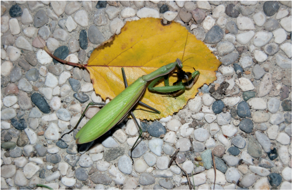
Slika 3: Bogomolka ( Mantis religiosa ) z umorjenim čmrljem.