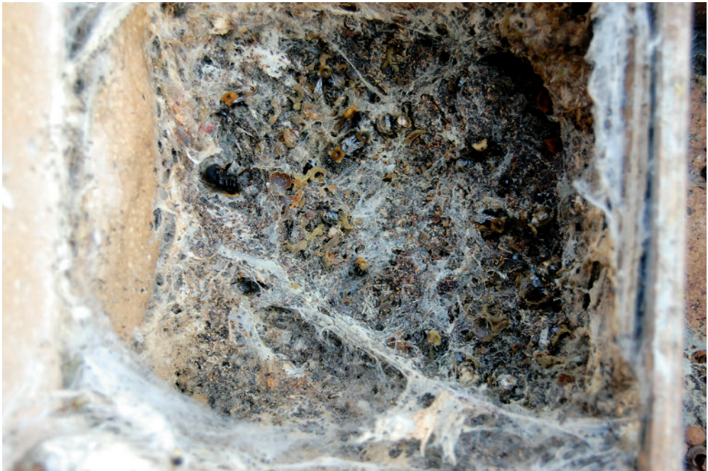
Slika 2: Voščena vešča ( Aphomia sociella ) – uničeno čmrleje gnezdo.

V juniju in juliju leta 2017 smo v čmrljaku v vasi Petelinje vzorčili različno prizadete čmrleje (umrle in žive z zakrnelimi krili), ki smo jih v nadaljevanju uporabili za