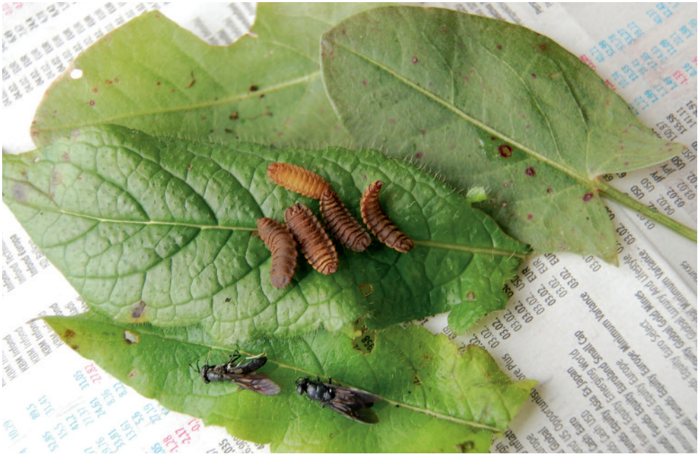
Slika 6: Bube in odrasli muhi Hermetia illucens iz čmrljega gnezda.