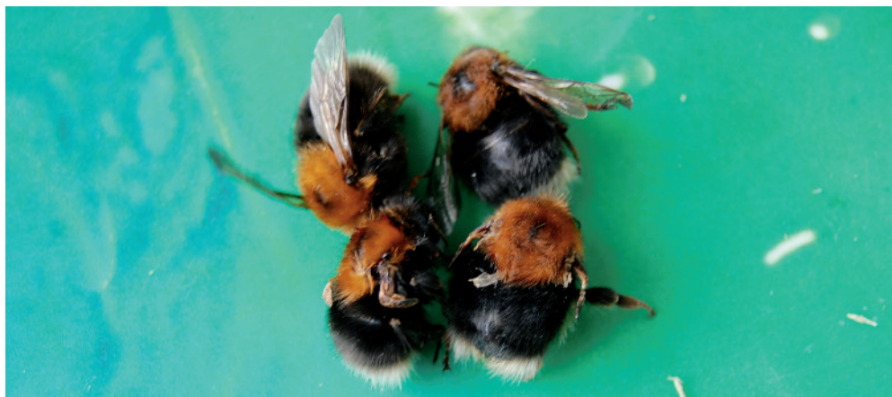
Slika 9: Štiri matice drevesnih čmrljev ( B. hypnorum ), dve z deformiranimi krili in dve z nepoškodovanimi krili.

1. Da so nekatere žuželke lahko čmrljem neškodljive, morda celo koristne, saj se prehranjujejo z njihovimi izločki in odpadki, medtem ko so druge škodljive ali celo njihove smrtne sovražnice.