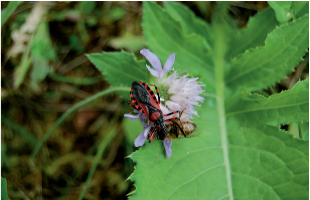
Slika 4: Roparska stenica rdeči nosan ( Rhinocoris iracundus ) z umorjeno čebelo.