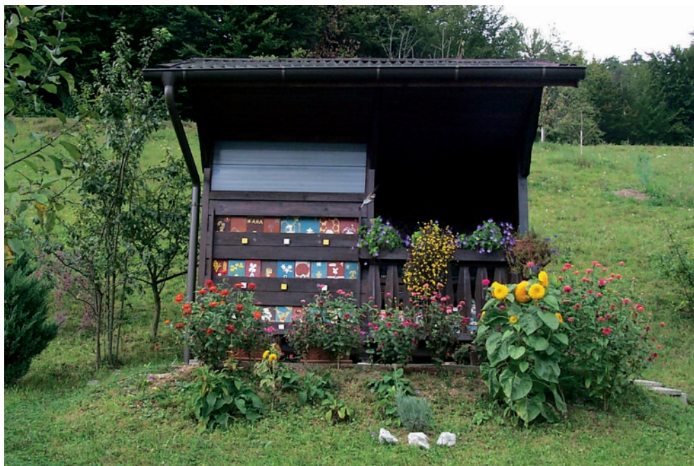
Slika 1: Čmrljak Janeza Grada, Petelinje 16, občina Dol pri Ljubljani, Slovenija.

čebelah. V nadaljevanju študij so v Nemčiji leta 2006 DWV prvič dokazali pri dveh vrstah čmrljev ( Bombus terrestris , Bombus pascuorum ), ki sta imeli podobno prizadetost kril, kot jo opisujejo pri okužbi čebel z DWV (Genersch et al., 2006). V letu 2014 so pri pregledu zbranih čmrljev iz 26 različnih lokacij po Veliki Britaniji DWV dokazali v 11% pregledanih vzorcev čmrljev, kar dokazuje, da je ta virus prisoten tudi pri čmrljih in bi lahko bil pomemben patogen, ki vpliva na zmanjšanje populacije čmrljev (Fürst et al., 2014). S proučevanjem in vse boljšim poznavanjem virusnih okužb čebeljih družin se domneva, da nekateri čebelji virusi okužujejo tudi druge vrste divjih čebel in tudi čmrlje (Dolezal et al., 2016). V Sloveniji spremljamo virusne okužbe pri čebelah od leta 2007 in splošno razširjenost nekaterih čebeljih virusov že poznamo, vendar čmrljev pri nas na virusne okužbe še nismo testirali (Toplak et al., 2012, Toplak, 2017).