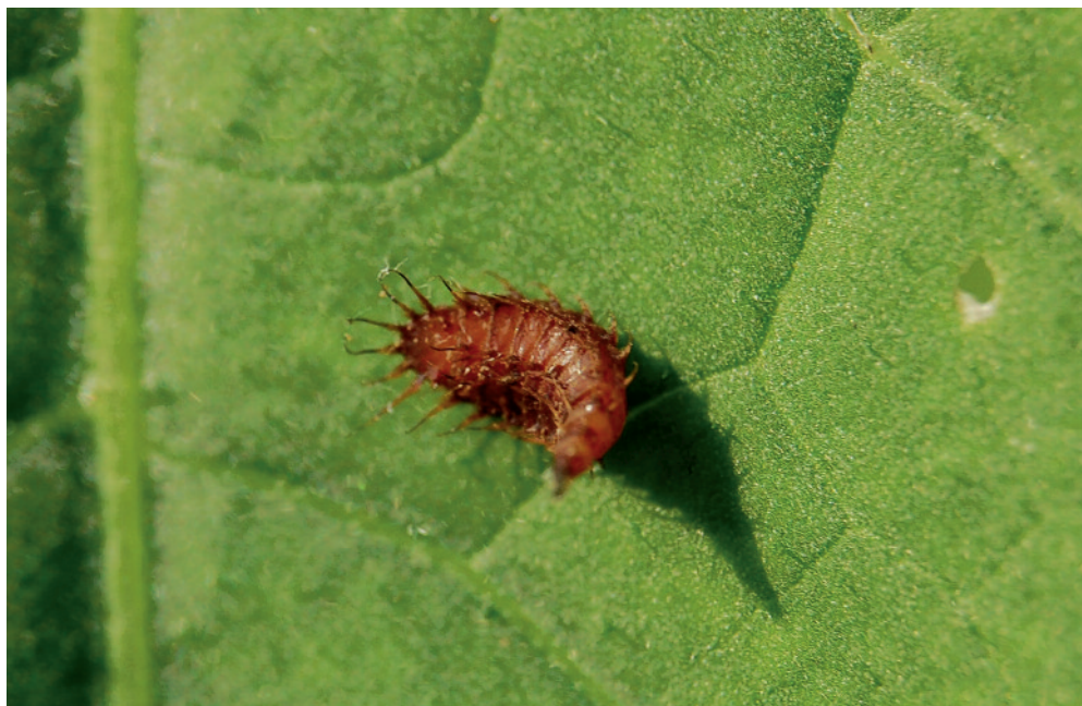
Slika 5: Ličinka muhe.