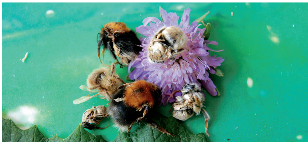
Slika 8: Čmrlji z deformiranimi krili, ki smo jih preiskali na prisotnost virusov.

Po večletnem opazovanju življenja čmrljih družin desetih vrst čmrljev (Grad et al., 2010; 2016) ugotavljamo: