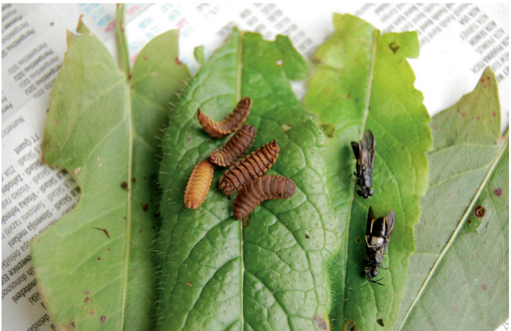
Slika 7: Bube in odrasli muhi Hermetia illucens iz čmrljega gnezda.