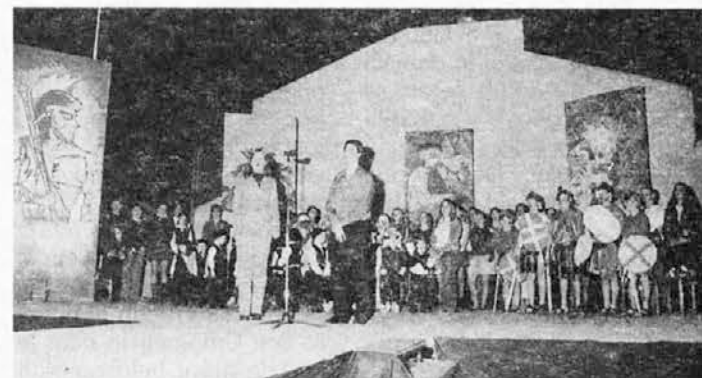
Nastopajoči na Mladinskem dnevu v Slovenski vasi (glej prejšnjo številko)

V slovenskem prostoru bo velik šotor, kjer bo razstava slovenskega naseljevanja v Argentini (ki je bila v emigrantskem muzeju), dopolnjena z gradivom o Slovencih v Rosariu. Vedno pa bodo na razpolago tudi tipične jedi za okrepčilo. Slovenci iz Rosaria toplo vabijo rojake tudi iz drugih krajev, da jih v teku Srečanja obiščejo.