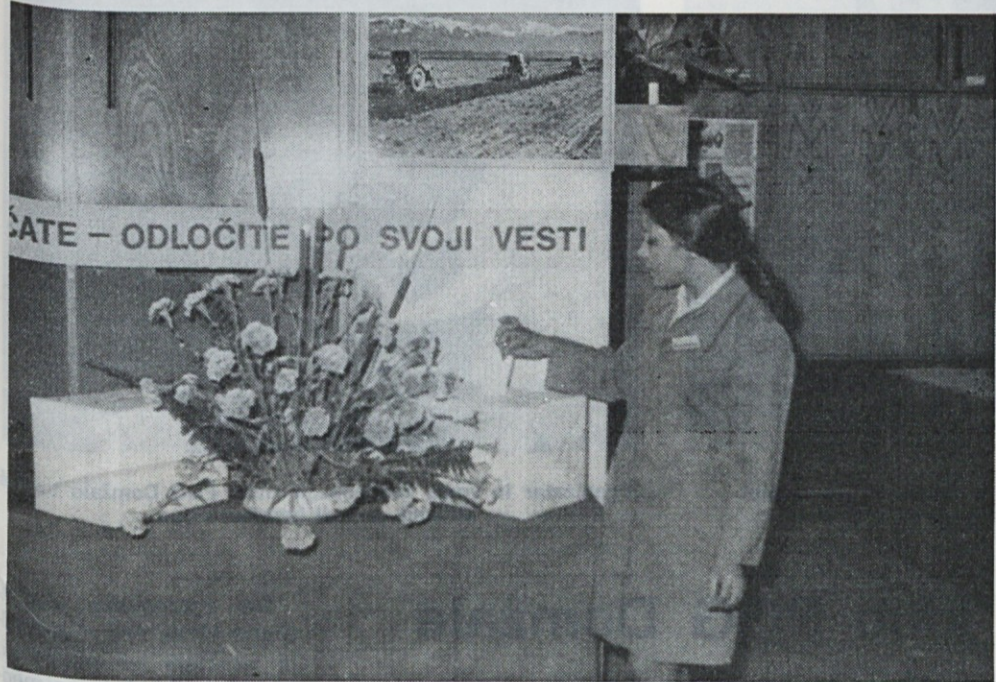
Odločili smo se za izenačitev zdravstvenega varstva kmetov in delavcev