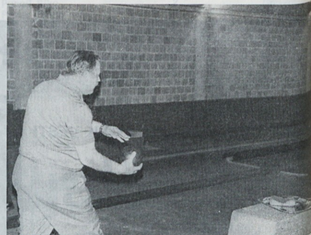
Organizator in vodja kegljaškega kluba PGG Domžale tovarnik Groznik je tudi kapetan ekipe