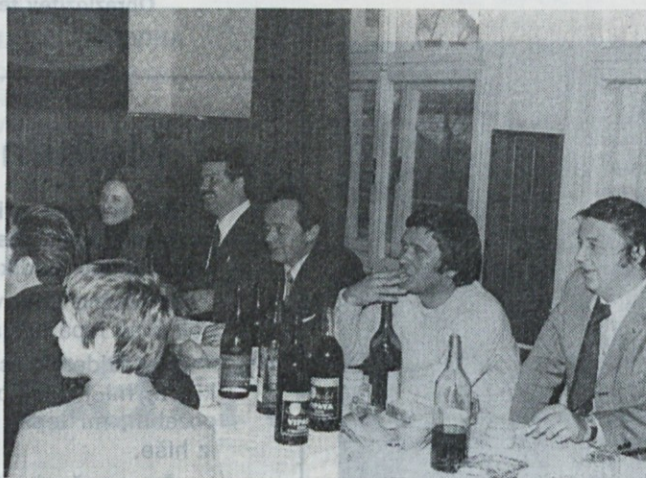
Prva tekma — prvi uspeh in seveda veliko veselje