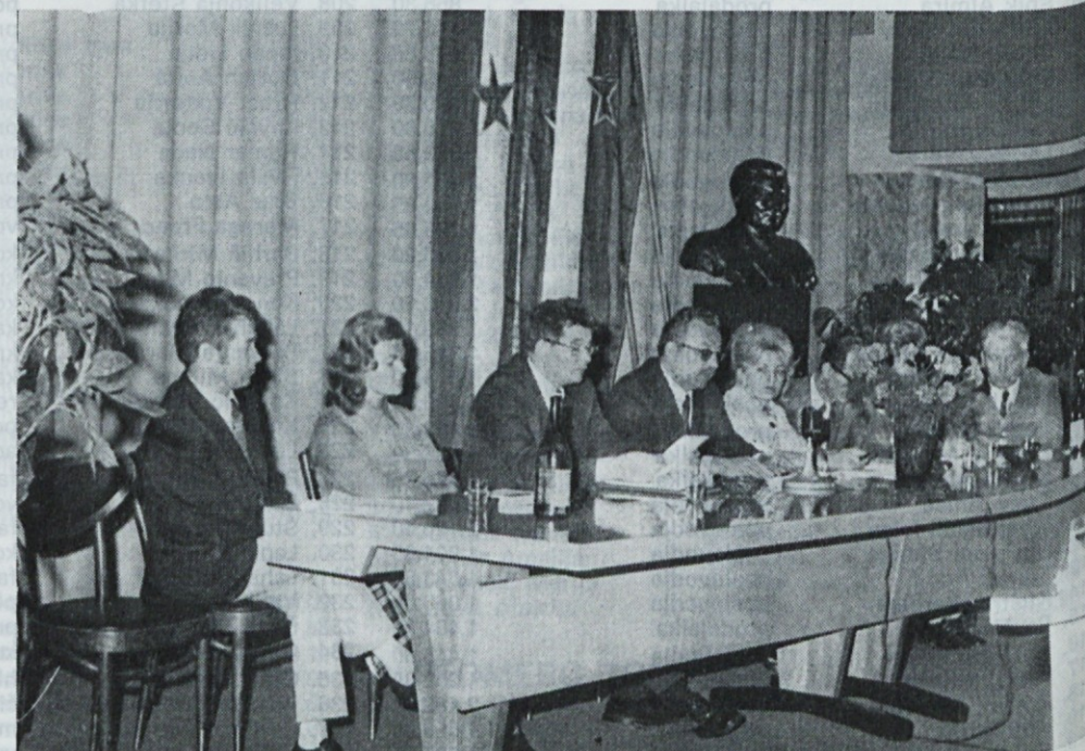
Delovno predsedstvo na Zboru samoupravljalcev