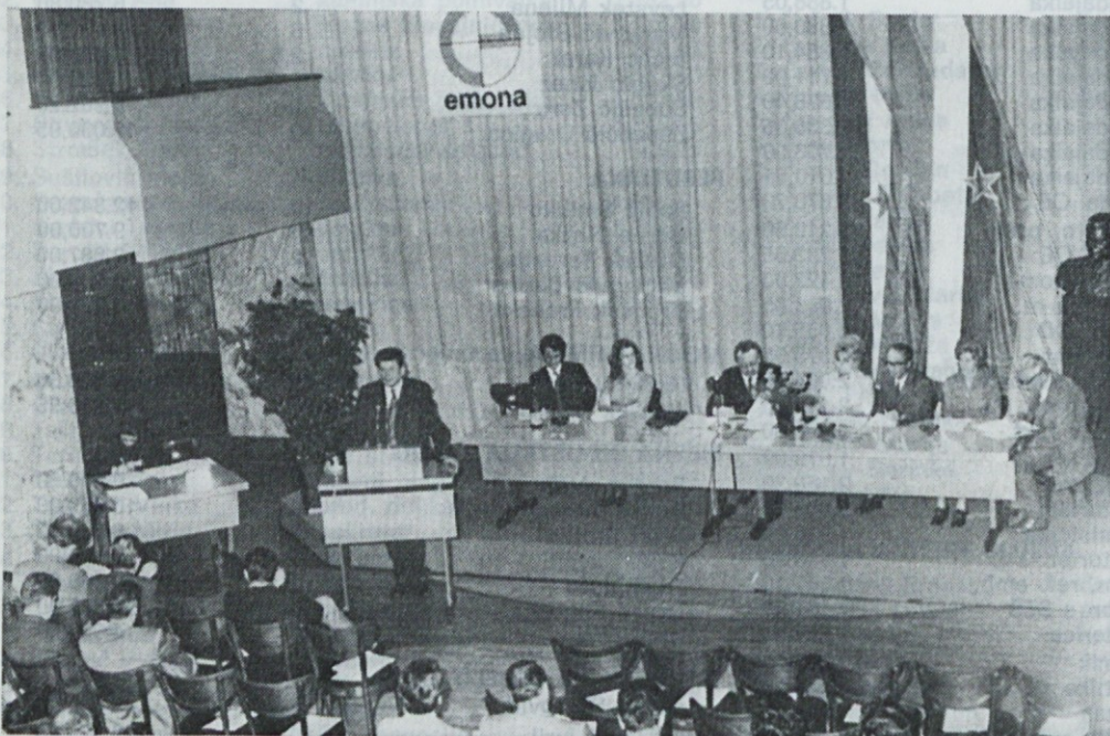
Diskusija samoupravljalcev je bila živahna