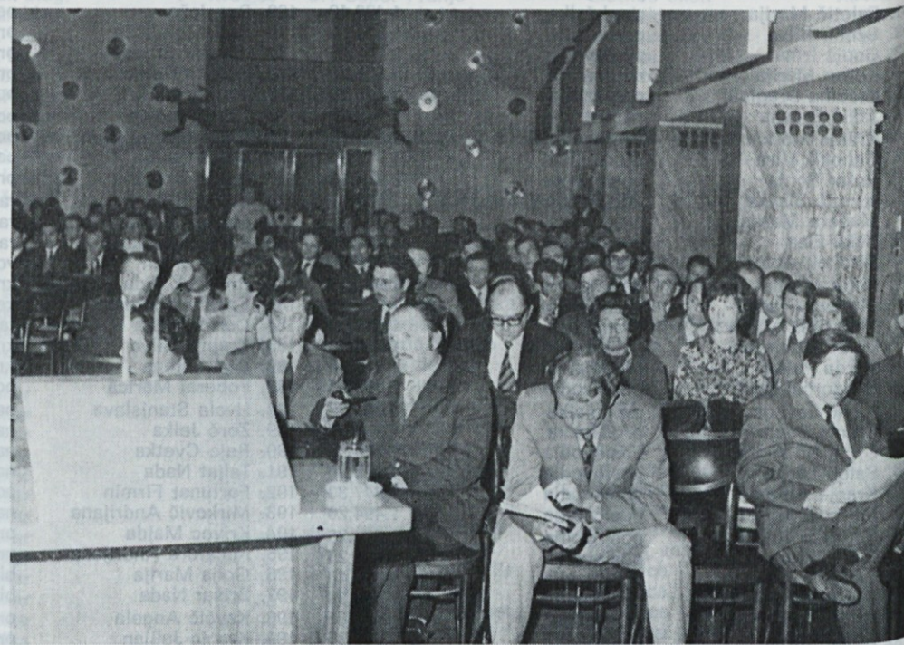
Zbor samoupravljalcev Emone je bil v Festivalni dvorani v Ljubljani 27. oktobra letos