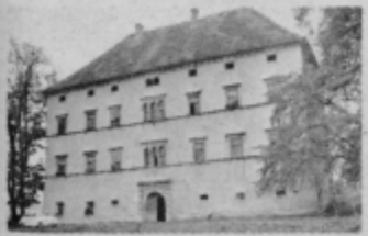
Pročelje gradu v Zg. Polskavi

so grad obnovljali tedanji lastniki. Leto kasneje pa je že dobil dokončno, današnje obliko in podobo. Grad ima tri nadstropja, kar je bila za tisto obdobje pomembna novost.