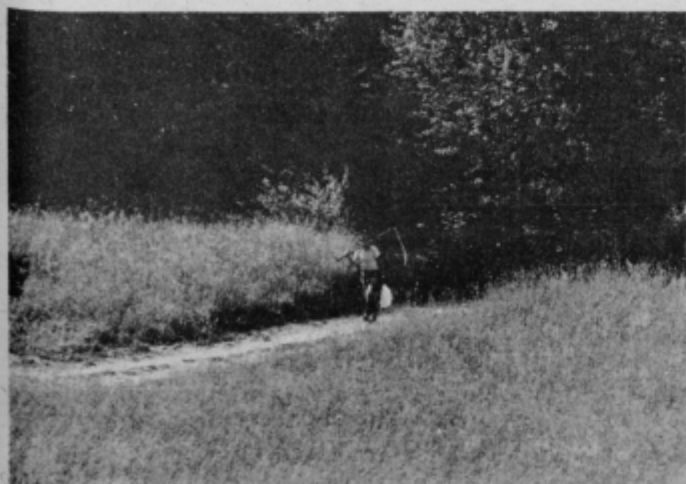
Ko se je delal svit, sem pa šel kosit . . .

Zaščitene kmetije morajo pomeniti dolgoročno ohranjanje kmetijskega prostora za glavno kmetijsko proizvodnjo in zagotavljanje zadostnega števila delovnih mest v kmetijstvu, ki bodo skrbela za ohranjanje naravnega ravnotežja in smotne izrabe zemlje v zasebni lasti. Pri oblikovanju odloka nastajajo prav tu težave, saj prostorske odločitve niso vedno usklajene z lokacijami zaščitene kmetij. O teh problemih bo potrebno še odgovorneje razpravljati tako v krajevnih skupnostih kot v okviru občine. ff