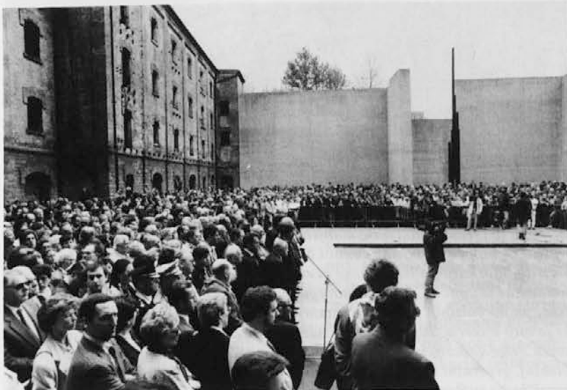
Množica na proslavi v tržaški Rižarni