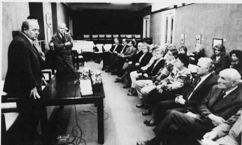
Simpozij o Francu Jezi je bil v Peterlinovi dvorani v Trstu

Petkov posvet ob 10-letnici smrti Franca Jeze je gotovo le nakazal pomen in širino njegovega dela. Bodoči preučevalci Jezovega političnega, literarnega in zgodovinskega pisanja, bodo morali poglobiti ta vprašanja in priznati, da je Franc Jeza neutrudno ustvarjal in nam je prav s tem svojim zgledom lahko za izziv, da bi vsakdo od nas na svojem polju in v svojem okolju deloval za narodni napredek, ki mora biti vsestranski.