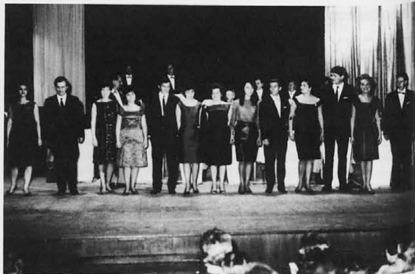
Nastopajoči na enem od prvih Festivalov slovenske popevke v Trstu pred tremi desetletji

Na sliki: slikar Kodrič v TK Galeriji