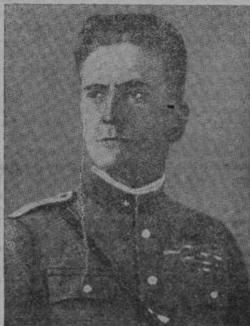
Poveljnik italijanskih čet v Abesiniji general Graziani.*