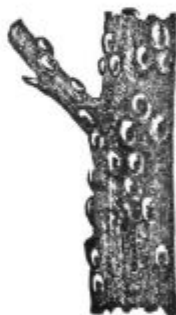
Pod. 20. St. José ščitasta ušica.

Ako se ne prične zgodaj z zatiranjem ušic, se to maščuje, kajti ko se enkrat listje zvije, ni možno priti z raztopinami ušicam do živega, ko se drevje škropi.