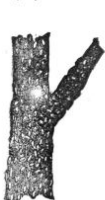
Pod. 18. Paličasta ščitasta ušica.

Najboljše sredstvo zoper te ušice je škropljenje sadnega drevja s Pleskotovimi karbolinejevimi raztopinami, katere se pripravijo za vsako rastlino posebej. S temi raztopinami naj se poškrpi sadno drevje kolikor mogoče na drobno in sicer zgodaj spomladi.