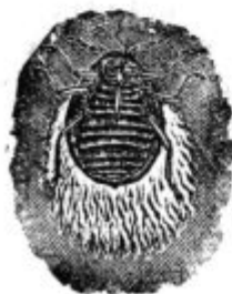
Pod. 21. Nekrilata samica.

Ta ušica se razločuje od drugih ušic in spozna se prav lahko, kajti obrastena je z dolgo belo volno, posebno starejše ušice imajo tako dolgo volno, da se poskrije pod isto neštevilno ušic. Cele črede te ušice se dobi na jablanovih mladikah. Ako to ušico pritisnemo, da od sebe kapljico krvavega soka, odtod tudi ime „krvava ušica“.