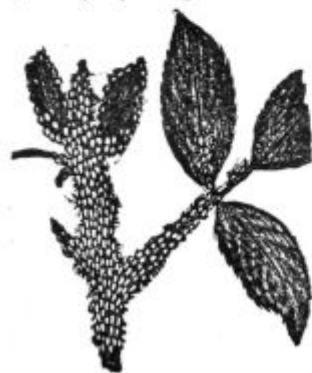
Pod. 17. Listna ušica.

Ker žive vsakovrstne ušice enako, zato bi bilo podrobnejše opisovanje posameznih vrst odveč, ker bi se moralo eno in isto vedno ponavljati. Glavna stvar za nas je, da vemo, kako se da ta mrčes zatreti, ali kedaj se prikaže v posebno velikem številu. Razširjanje tega mrčesa odvisi od raznih okolnosti. V prav suhih ali prav mrzlih in deževnih letinah napada drevje in grmovje v manjši meri, kakor pa v toplih in srednje mokrih letinah. V teh poslednjih letinah se poloti sadnega drevja tako hudo, da je isto že početkom septembra popolnoma brez listja.