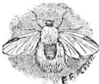
Pod. 22. Krilata samica.