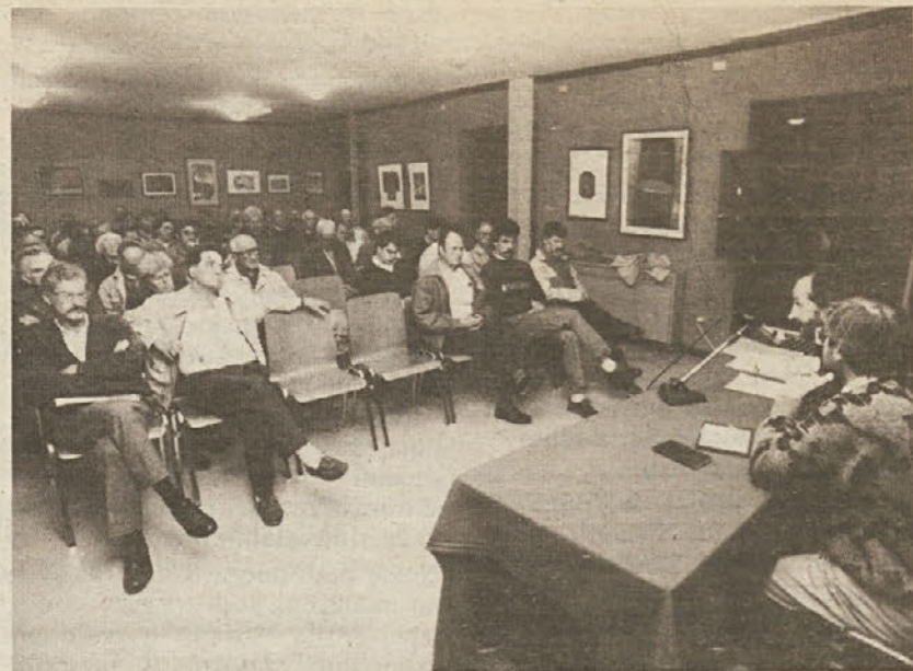
■ Na pokrajinskem aktivu slovenskih tovarišev: odkrito, prizadeto in odgovorno zagovarjanje mnenj.

Težavni odnosi med Slovenci in Italijani v Furlaniji—Julijski krajini še zlasti pa na Tržaškem so po mojem tudi posledica dejstva, da smo vsi — zlasti Italijani, a tudi Slovenci — še vedno vključeni v spono preteklosti, na katere občasno pozabimo, a ki pridejo vselej jasno do izraza, brž ko bruhne na dan polemika o nacionalnem vprašanju ali o posledicah vojne. In še danes, prav kot pred štirimi desetletji, ko so bile vojne rane še nezaceljene in je bila teritorialna pripadnost STO pod vprašajem, ravno tako žolčno prerokamo o Rižarni in fojbah, očitamo drug drugemu grozodejstva in okrvavljene roke. Glavno odgovornost za to imajo seveda nacionalistični krogi, ki se ohranjajo pri življenju z oživljanjem nasprotij preteklosti, in tiste zmerno sile, ki se sklicujejo na nacionaliste, da bi zavrle demokratično rast in razvoj tukajšnje