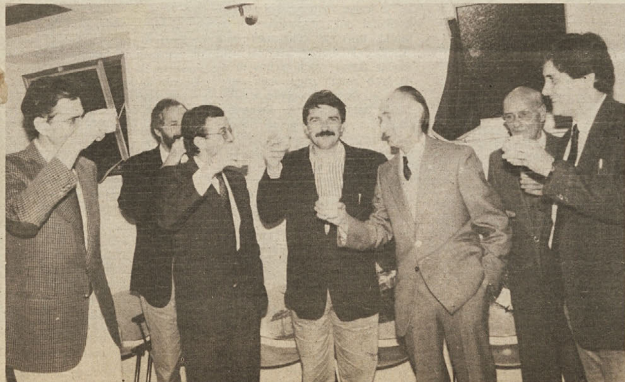
■ "Dragi tovariš Kiljan! Še na mnoga, zdrava leta ti kliče tudi DELO!"

MILJČANKE IN MILJČANI! 22. IN 23. OKTOBRA GLASUJTE ZA LISTO FRAUSIN!