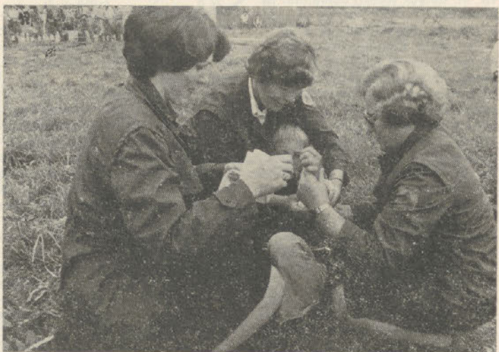
Dajanje prve pomoči ponesrečencu

Paket bo v vsakdanjem življenju tudi nekakšen regulator med zalogami prehrabnih artiklov, predvsem v dnevih ko nakup v