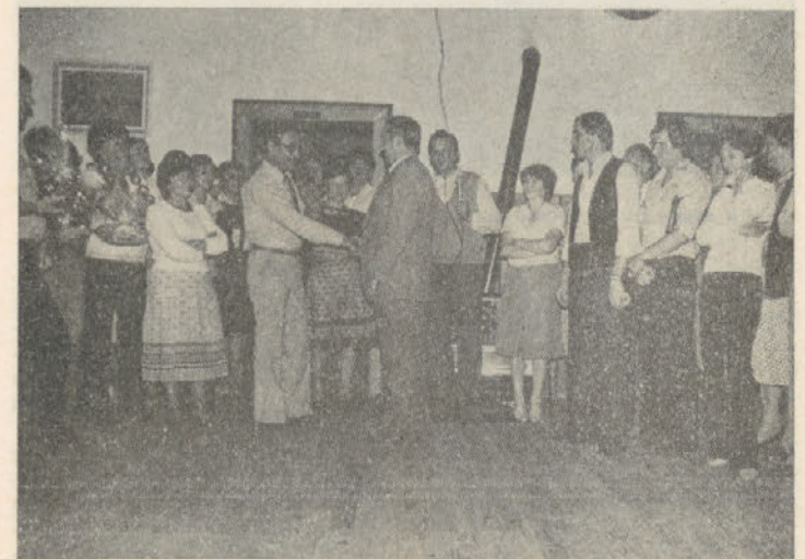
Prijateljski stisk rok predstavnikov obeh kolektivov

Na teh srečanjih se med delavci obeh kolektivov zraven športnih tekmovalj razvija duh prijateljstva in medsebojnega zaupanja, saj bi brez dobrih odnosov težko dosegali takšne delovne uspehe, kot smo jih dosedaj.