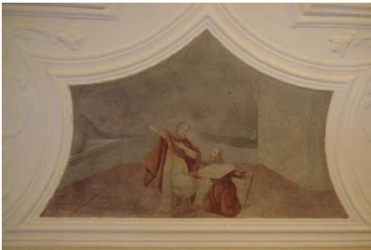
Sranska freska na zahodni strani sobe (okno) verjetno poudarja človeški napuh zaradi odkritja novih kontinentov. V centru pozornosti je globus.