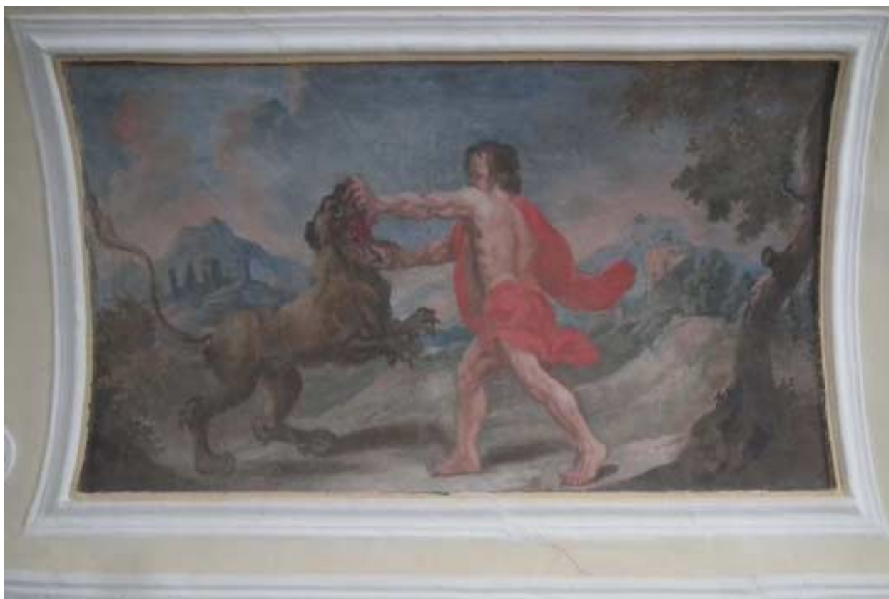
Samson in lev. Freska se nahaja takoj nad vrati v viteški dvorani.