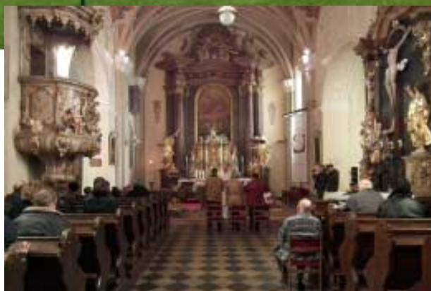
Župnijska cerkev sv. Trojice v Veliki Nedelji je eden najpomembnejših sakralnih spomenikov v Sloveniji. Ohranjena je romanska pozidava z istodobnimi plastikami.