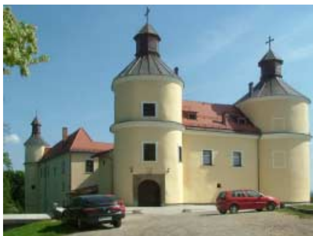
Grad Velika Nedelja