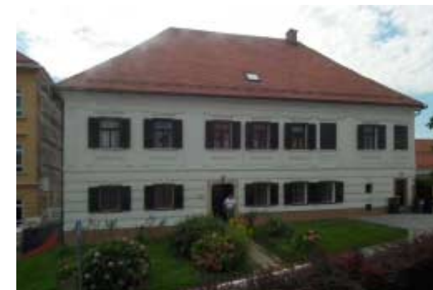
Župnišče v Veliki Nedelji

V duhu takratnega razburkanega časa, se je najbolj izrazil umetnik na freskah v sedanjih spalnici. Vse freske so sicer narisane kot prizori iz časa Janezovega razodetja (način oblačenja in okolje). Verjetno posebej poudarjajo božjo jezo nad človeškimi grehi takratnega časa.