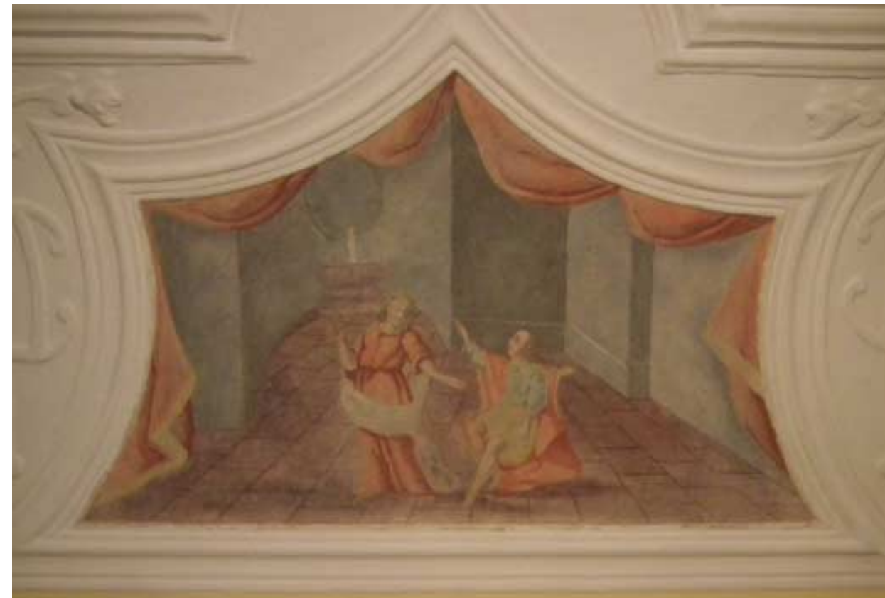
Sranska freska v severovzhodnem delu sobe (vrata) verjetno hoče pokazati na greh, ki ga delajo moški na zlatem sedežu zaradi lepih žensk.