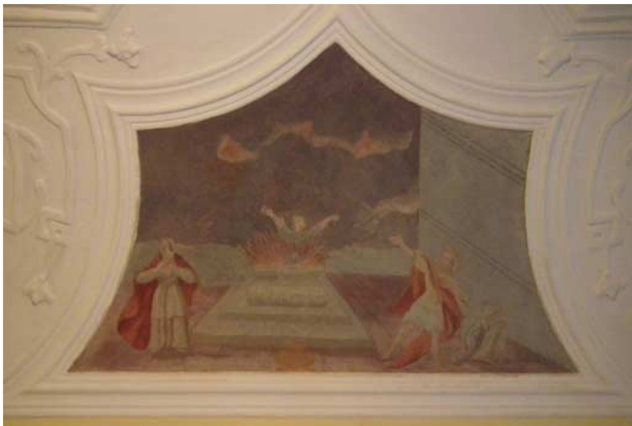
Sranska freska na južnem delu sobe skoraj zagotovo prikazuje božjo jezo nad človeškimi žgalnimi daritvami, ki Bogu niso všeč.