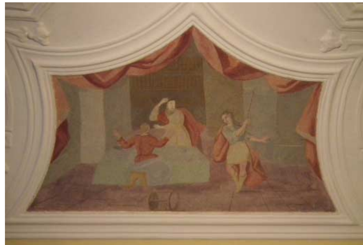
Sranska freska na severnem delu sobe prikazuje pretirano zanašanje človeka na učenost, ki ni všeč Gospodu (mladenič v zamahu s palico). V ozadju freske so tabulariji (plošče na katere so nekoč pisali). Na mizi so verjetno kakšni pomembni dokumenti. Pod mizo pa je prevrnjeno stojalo globusa.