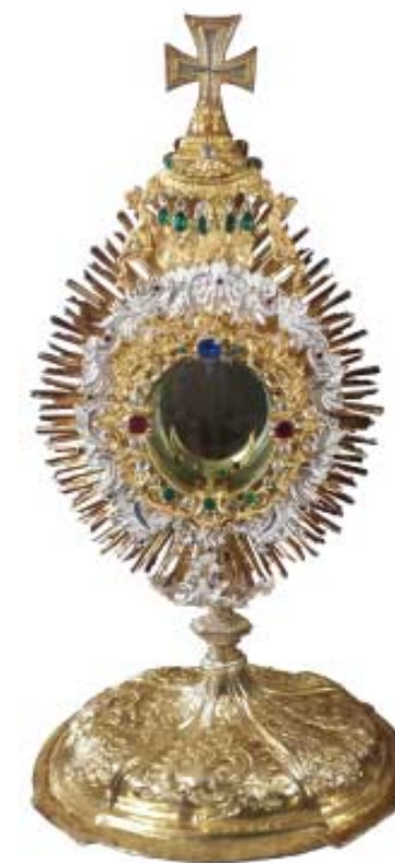
Križniška moštranca iz 18. stoletja (Kog, Sv. Boļfenk). Pred 60 leti je bila ukradena. Leta 2011 je bila vrnjena iz Avstrije.

Strokovnjaki menijo, da so freske stare vsaj 275 let, tako kot tudi župnišče v sedanji obliki. Kdo je takrat bival v župnišču ni popolnoma jasno. Zagotovo so bili križniki (nekoč nemški viteški red) lastniki gradu v Veliki Nedelji. Bili so gospodarji vsega lokalnega, svetnega in inkorporiranega cerkvenega imetja ter dovolj bogati, da so lahko plačali umetnike.