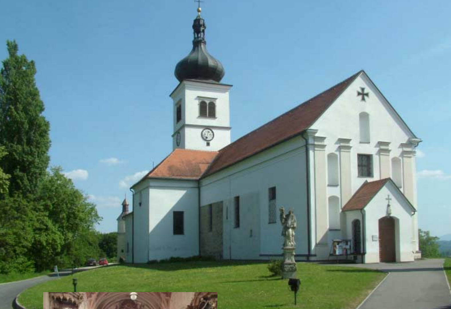
Pfarrkirche St. Dreieinigkeits