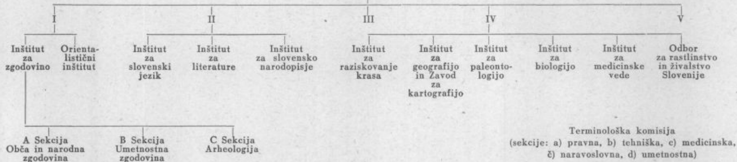
Preglednica organizacije Slovenske akademije znanosti in umetnosti