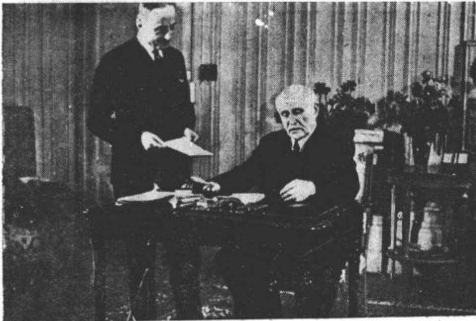
Maršal Petain v svoji delovni sobi

Količine se za posamezne stranke lahko povečajo ali zmanjšajo v skladu s spremembami števila družinskih članov potrošnikov. Vsi prestopki te uredbe se bodo kaznovali po predpisih uredbe o ureditvi prodaje blaga od 8. novembra 1940.