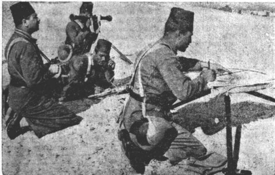
Egiptsko vojaštvo na velikih vajah