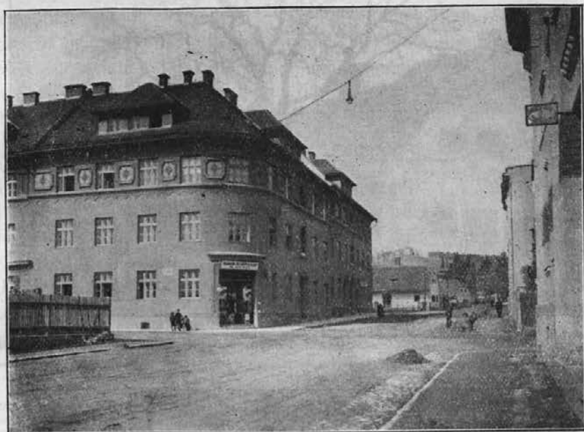
Slika 1. Maribor. Severna Vrtna ulica.

vesti, ker je hiša v mestu tisti prvotni vir, od katerega prevzema motive hiša na deželi. Najbolj jasno se vidi ta razlika tam, kjer prodira mestna stanovanjska hiša med konservativne bivše kmetijske hiše nekdanjega predmestja (sl. 1.). Poleg raznolike velikosti je jasna razlika v linijah;