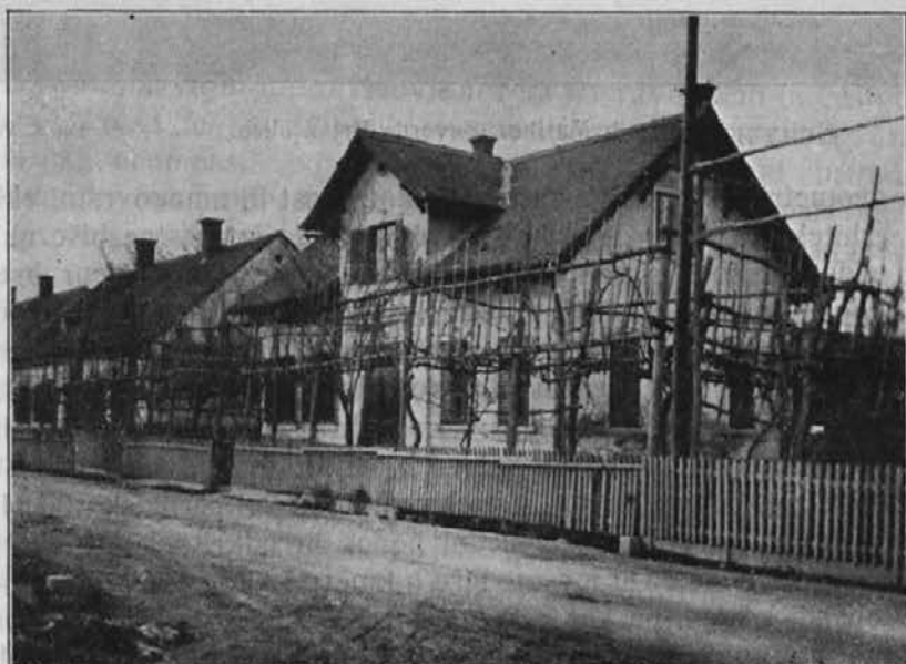
Slika 3. Studenci, Cesta Kralja Petra.