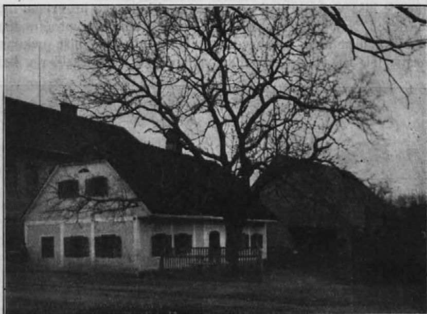
Slika 2. Pekre.