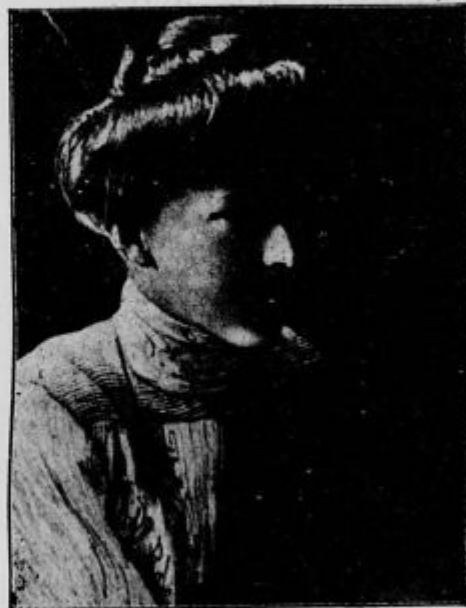
Novi belgijski kralj Albert in kraljica Elizabeta.

lika nesreča. Deželni predsednik naj skrbi, da bo predor v najkrajšem času otvorjen.