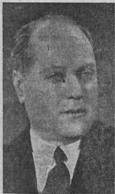
Bolgarski ministrski predsednik dr. Kiosevanov

Papež je te dni potom škofov izdal na vse balkanske in podonavške narode proglas, naj se ubranijo ruskega komunizma. To je menda edini strah, ki pa je neopravičen in se ga nihče ne boji.