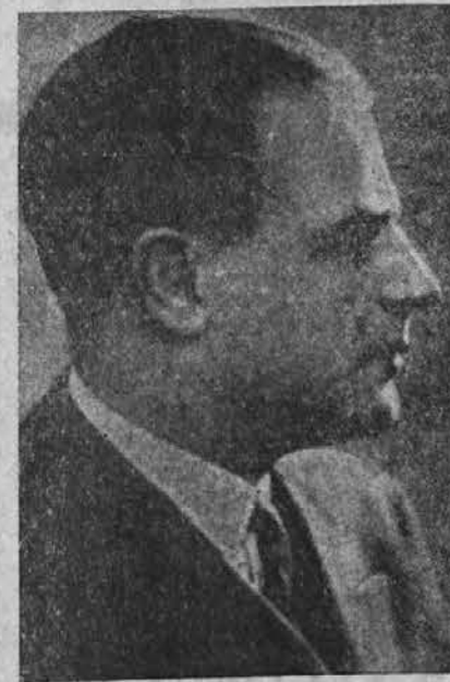
Georgi Gafencu, romunski zunanji minister