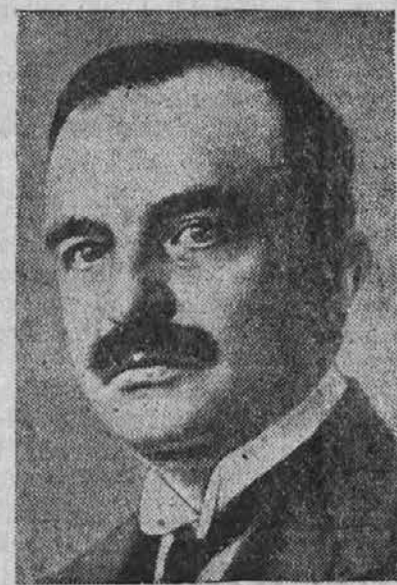
Grški ministr. predsednik Metaxa