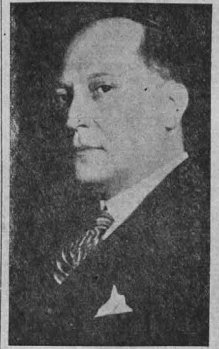
Dr. Cincar-Marković, jugoslovanski zunanji minister