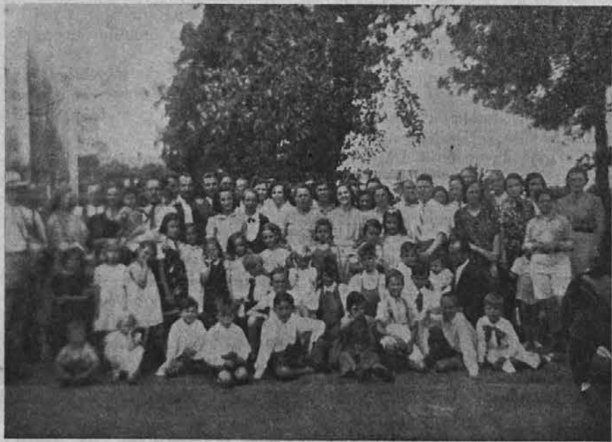
Otroke paternalske šole so obiskali njihovi starši, ko so se šolarji nahajali na počitnicah v San Antonio de Padua

"Tu ti dam kos potice, draga sestrica. Deli ga z menoj tako kakor se dobri sestrici spodobi!"